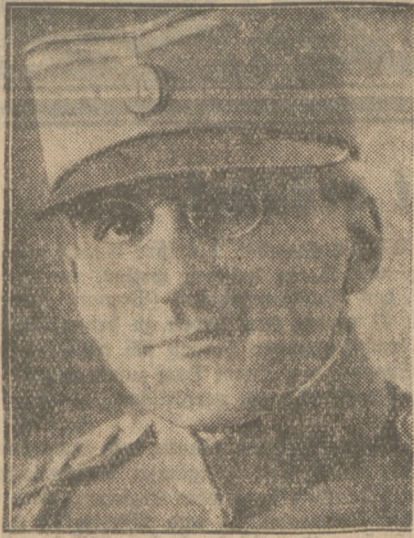
König Alexander von Jugoslawien

Italien und Frankreich haben von dem ihnen zustehenden Recht, je 60 000 ts Flug-