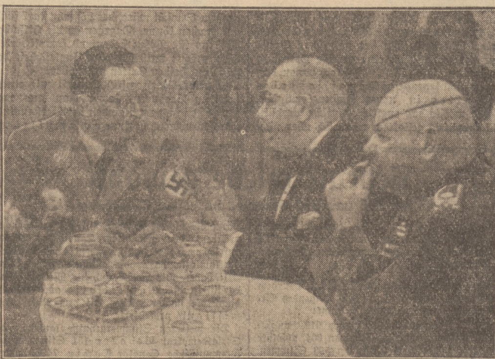
Empfang auf der Prager Burg

Hauptredakteur: Günther Rinke. — Totales und Sport: Alexander Jursch. — Provinz und Wirtschaft: Eugen Petrucci. — Kunst und Wissenschaft, Feuilleton, Wochenbeilage „Heimat und Welt“, Unterhaltungsbeilage: Alfred Loake. — Für den übrigen redaktionellen Teil: Eugen Petrucci. — Anzeigen- und Reklameteil: Hans Schwarzkopf. Alle in Polen, Al. Marz, Pilsudskiego Nr. 25. — Verlag und Druckort, Herausgeber und Ort der Herausgabe: Concordia Sp. Akc., Druckerei und Verlagsanstalt, Posen, Al. Marz, Pilsudskiego 25.