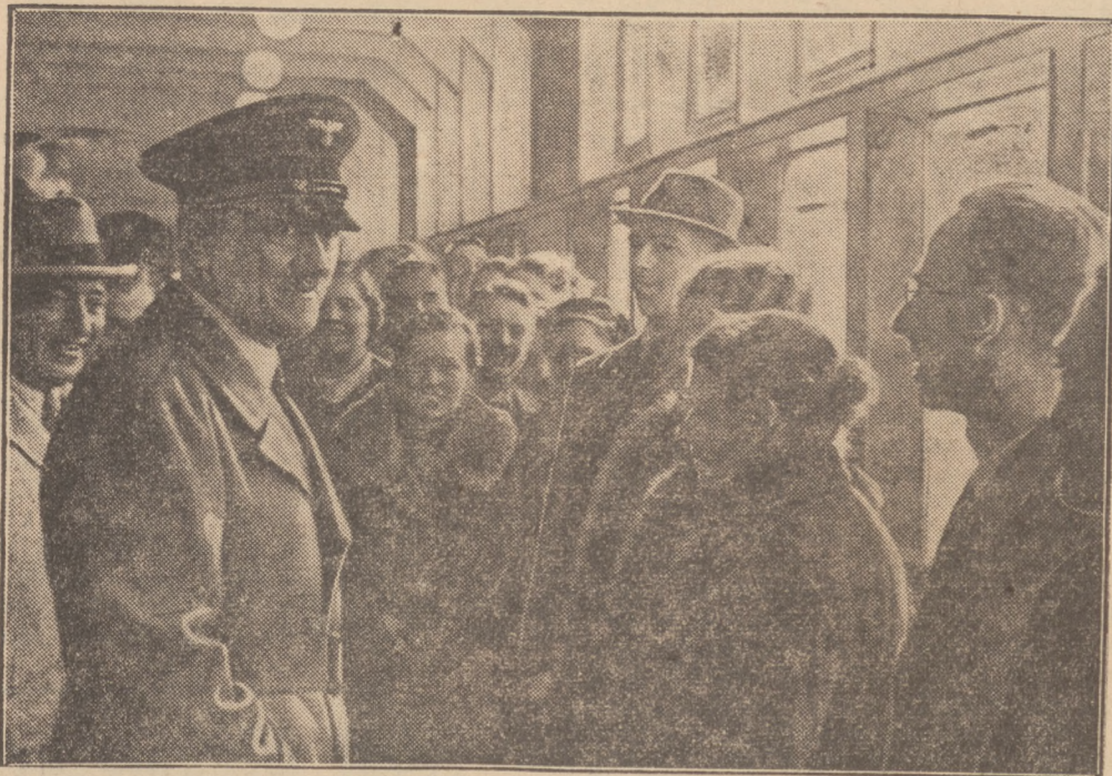
Von der Nordseefahrt Adolf Hitlers mit den AdF-Urlaubern

Der tödlich verunglückte König des Irak Der König sah selbst am Steuer seines Kraftwagens, als er in Bagdad gegen einen Elektrizitätsmast fuhr und eine knappe Stunde nach dem Unglück starb.