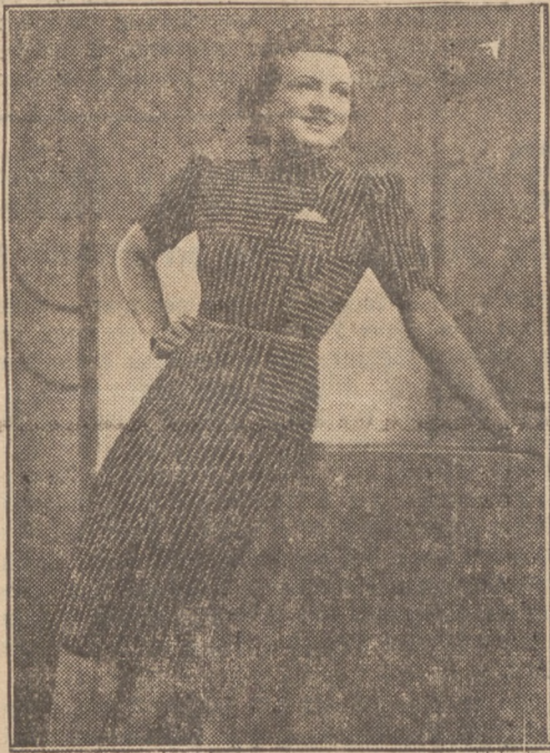
Wiener Modeschläge für die Frau

Links: eine vorbildlich schide Weste aus weichem Mohairgarn, die durch helle Kurbelstückerie und Einfassung geziert ist. Rechts: ein flottes Jerseykleid, das durch die aparte Aufteilung des Streifenmusters besonders interessant gestaltet ist.