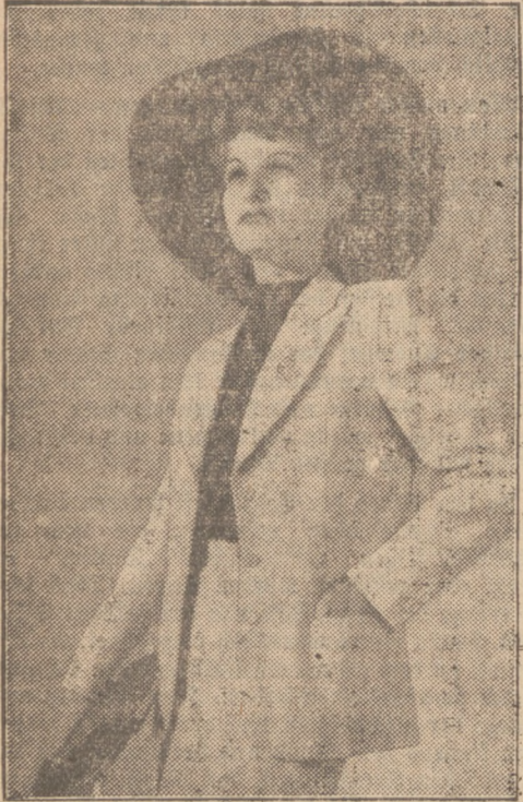
Einiges junges Schneiderstümmel

Nach vielen Blumendrucken und phantastischen Mustern kehren wir zur Einfarbigkeit des Materials zurück. Der Straßenanzug für die letzten schönen Sommertage besteht aus dem sandfarbenen Wolstoff, mit rotroter Seidenbluse getragen. Und als Gegenstück zu diesem strengen Stil: der große Randhut.