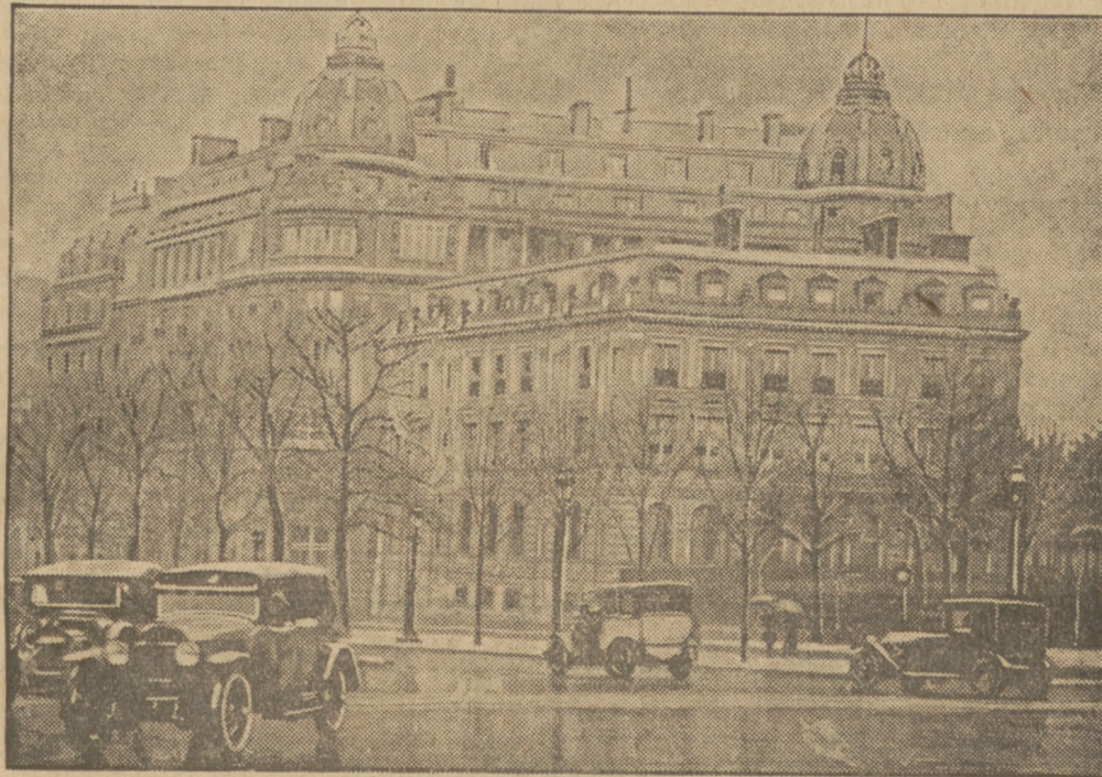
Der Sitz der Pariser Sachverständigen-Kommission.