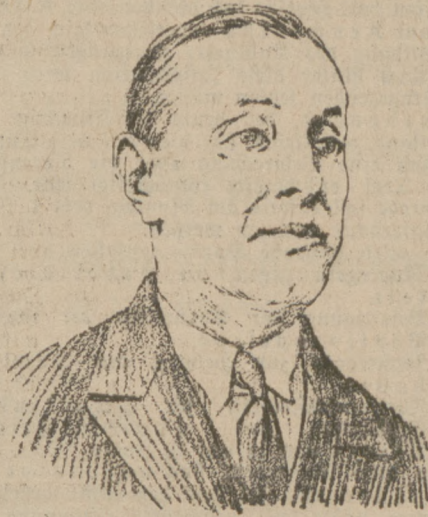
Der neue Völkerbunds-Kommissar für Danzig.

So ergab es sich aus diesen äußeren und inneren Gründen mit natürlicher Notwendigkeit, daß Sie sich schnell in Ihren neuen Wirkungskreis einleben konnten und all den oft nicht leichtesten Fragen, die an Sie im Laufe der vergangenen Jahre herantraten, regles Interesse entgegenbrachten. Als ich Sie bei Ihrem Antrittsbesuche im Senat, Februar 1926, begrüßte, da habe ich betont, daß Danzig und Polen in erster Linie alle zwischen Ihnen auftauchenden Fragen im Wege der Vereinbarung regeln wollten und nur, soweit dies nicht möglich, die Vermittlung des hohen Kommissars anrufen würden. Auf diesem Wege ist es nun in Ihrer vergangenen Amtszeit erreicht, die Zahl der Entscheidungen auf ein möglichst geringes Maß zu