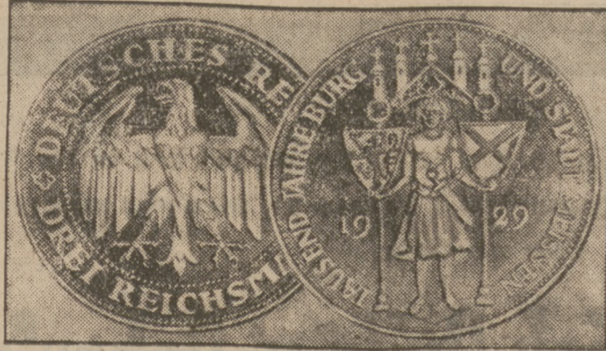
Jubiläumstaler der Stadt Meißen,

Essen, 21. Juni. (R.) König Ruad begab sich gestern Abend im Sonderzug nach Halle.