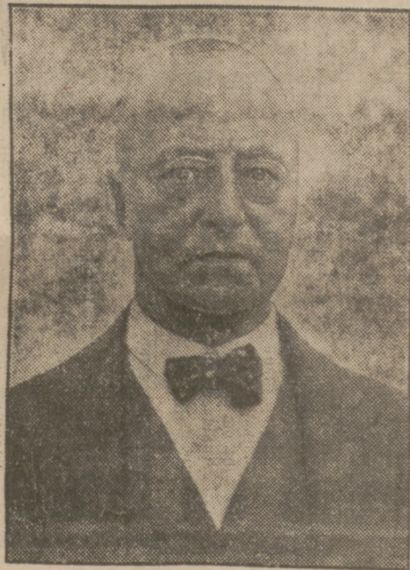
Wechsel bei der Leitung der Zeppelin-Werke.

Berlin, 21. Juni. (R.) Nach einer „Vorwärts“-Meldung hat die deutsche Abordnung in der Komintern den Antrag zum Ausschluß Frau Klara Zetkins aus der Komintern und der Gewerkschaftsinternationale gestellt.