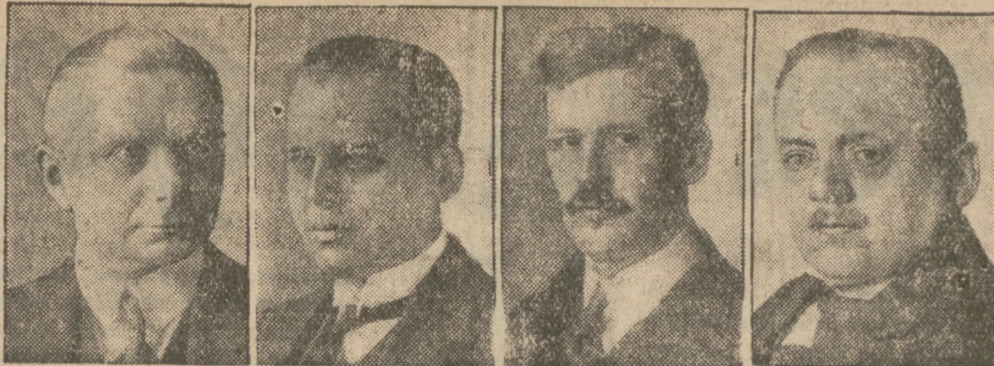
Die große außenpolitische Aussprache im Reichstag.

Oberstleutnant Edmund von Terstyanitzky, der ungarische Olympia-Sieger im Säbelfechten in Amsterdam, der vor einigen Tagen mit dem Motorrad verunglückt war, ist in Budapest seinen schweren Verletzungen erlegen.