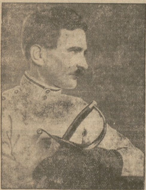
Der Olympia-Sieger im Säbelfechten tödlich verunglückt.

Der „Goniec Wielkopolski“, der hier auf einer unverschämten Lüge erpapt worden ist, wird freilich von dieser Richtigstellung keinen Gebrauch machen. Wir sind jedoch der festen Überzeugung, daß die angelegte Klage den einen Erfolg haben wird, daß in Zukunft den Lügenmärchen ein kleiner Riegel vorgehoben wird.