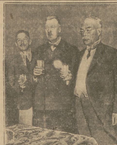
Von der Weltfahrt des „Graf Zeppelin“.