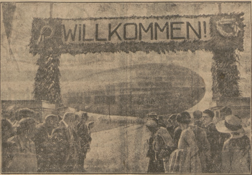
Zeppelin Ankunft in der Heimat. Das Luftschiff nach Beendigung seiner Weltfahrt vor der Landung in Friedrichshafen, wo Luftschiff und Besatzung festlich empfangen wurden.

England und Rußland. Genf, 5. September. (R.) Henderson erklärte dem Reuters-Korrespondenten, daß die tatsächliche Wiederaufnahme der Beziehungen zu Rußland erst erfolgen kann, wenn das Parlament über die Angelegenheit informiert worden ist. Der Wunsch der britischen Regierung ist es, die Beziehungen so bald als möglich auf eine wirtschaftliche und solider Basis wieder aufzunehmen.