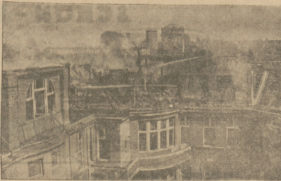
Einsturz-Ünglück bei einem Großfeuer in Berlin.

Ueberempfindlichkeit? Der Burgrichter D. bemerkte auf einem Spaziergange in Solatich einen 15jährigen Knaben, wie er, nur mit Badehose bekleidet, in der Villa seiner Eltern ein Sonnenbad nahm. Empört darüber, holte er einen Polizisten, der sich Notizen machte. Der Knabe erhielt einen Strafbefehl über 60 Z. Der Vater des Knaben beantragte gerichtliche Entscheidung. Zur Verhandlung am Dienstag kam es aber nicht, weil das Gericht den Strafbefehl aus formalen Gründen nicht anerkannt hatte.