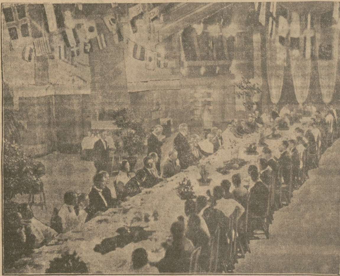
Von der Weltfahrt des „Graf Zeppelin“.

Denn: entweder entstehen die U. S. E., oder wir gehen alle insgesamt wirtschaft- lich zugrunde; politisch stürzen wir dann in das rote Chaos des Bolschewismus. Vor diesem Schrecken aber soll uns der allmächtige Baumeister aller Welten be- wahren.