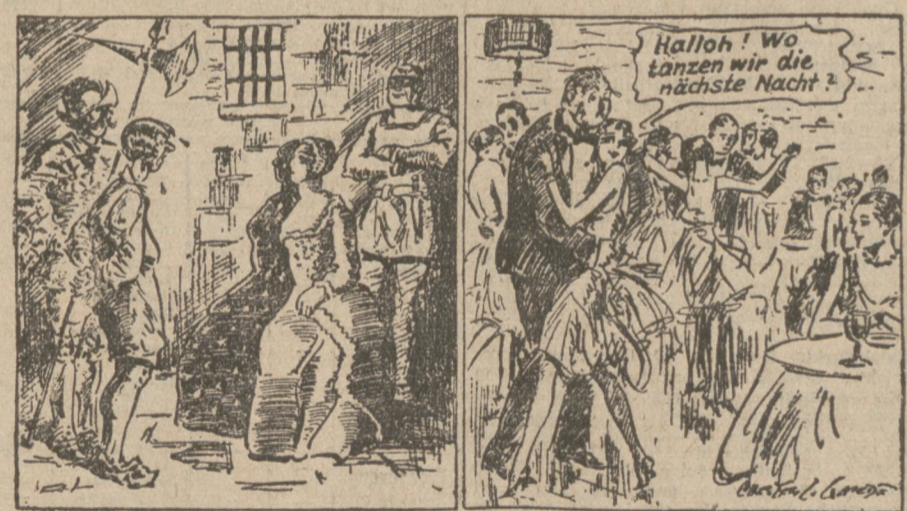
Humor des Auslandes. Die eiserne Jungfrau. Einst. Jetzt. („Judge.“)