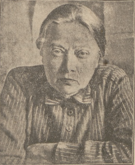
Rant und Schopenhauer in Sowjet-Russland verboten.

68. Jahrgang Donnerstag, den 12. Dezember 1929 Nr. 286