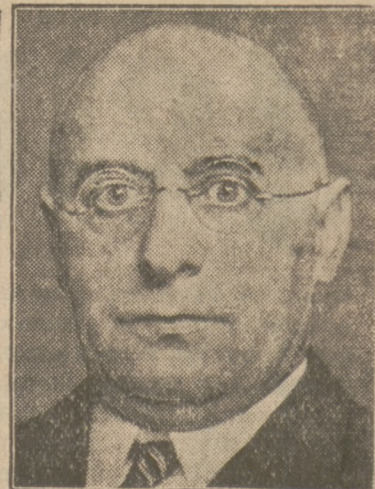
Zur Neubildung der Reichsregierung.