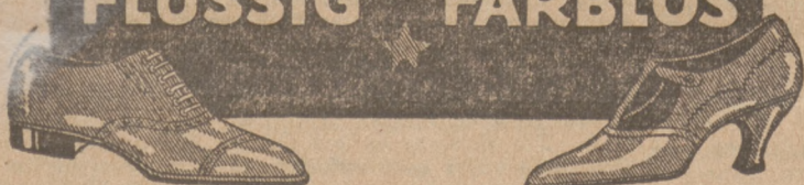
GERBRÜDER KROMER, Eos-Werke