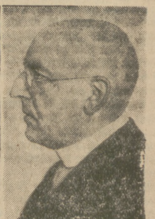
Die neue Regierung in Oesterreich.

Das neue österreichische Kabinett wurde von dem bisherigen Heeresminister Baugoin mit Unterstützung der Heimwehren gebildet. Die führenden Köpfe der neuen Regierung (von links nach rechts): Bundeskanzler Baugoin, Fürst Starhemberg, Erster Führer der Heimwehren der das Innenministerium übernimmt, und Dr. Seipel, der neue Außenminister.