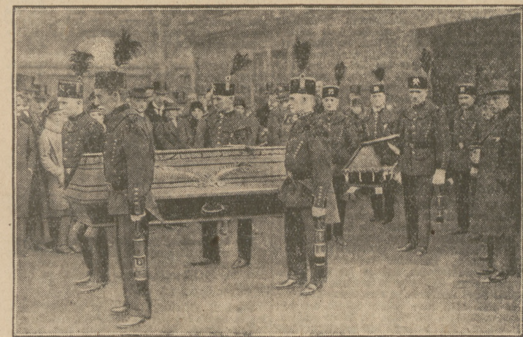
Der Schlusssatz der Alsdorfer Tragödie.