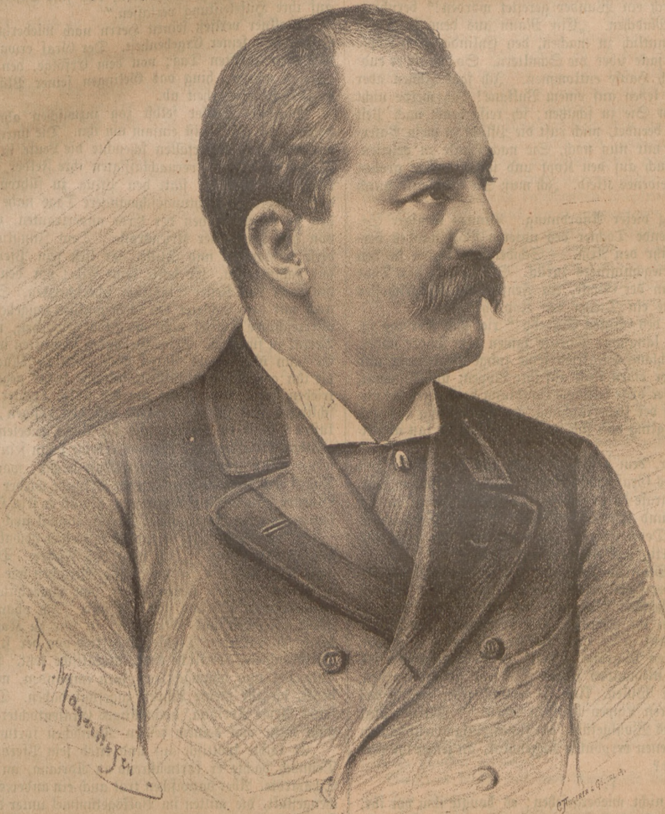
König Milan I. Obrenowitsch von Serbien. (Mit Text.)

Diese Worte erinnerten Siegfried erst daran, daß er etwas für die