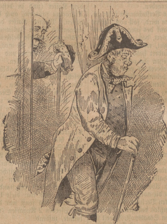
Der zerstreute Michelbauer.

Eine denkwürdige Resolution. Als weiland Ihrer Majestät der Kaiserin Maria Theresia von dem Hofkriegsrat, unter dem Präsidium des Feldmarschalls Lacy, am 31. Dezember 1770 zur Sanction das Pensions-System für Offiziere, Witwen und Waisen unterlegt wurde, gab die unsterbliche Frau eigenhändig folgende rührende Resolution: „Dieses Werk hat mir ein ganz besonderes Wohlgefallen verursacht, daß auf die alte und meritierte Offiziers, ihre Wittiben und Kinder besser bedacht wird. Nebst so großen und heilsamen Vorkehrungen, die ich dem Präsidenten und Rat zu danken habe, so ist doch dieser einer, der mich am meisten freut, weil die Billigkeit, Versorgung und Menschenliebe darin vollkommen finde und also auch in all anderen Vorfällen mein Vertrauen billig vermehrt.“ Maria Theresia.