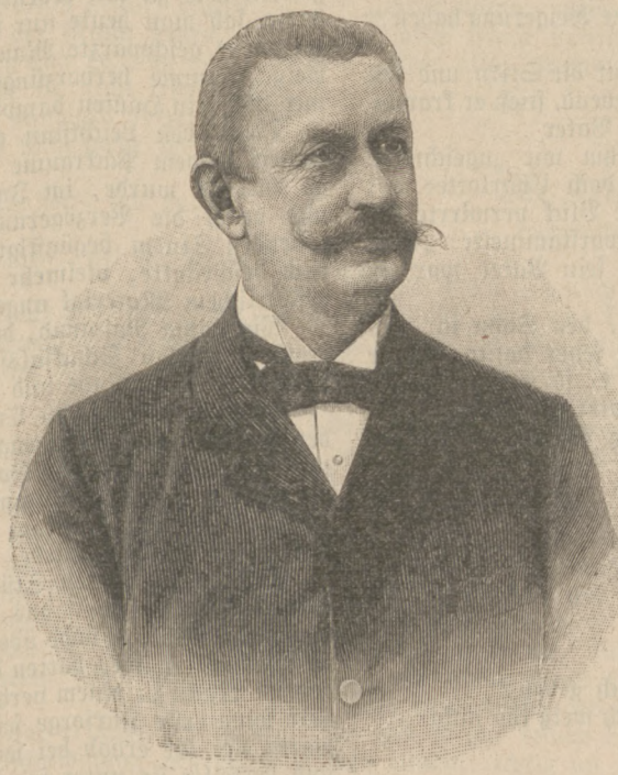
Eugen Rüff, der neue schweizerische Bundespräsident.

Wieder hielt sie inne, erhielt aber noch immer keine Antwort.