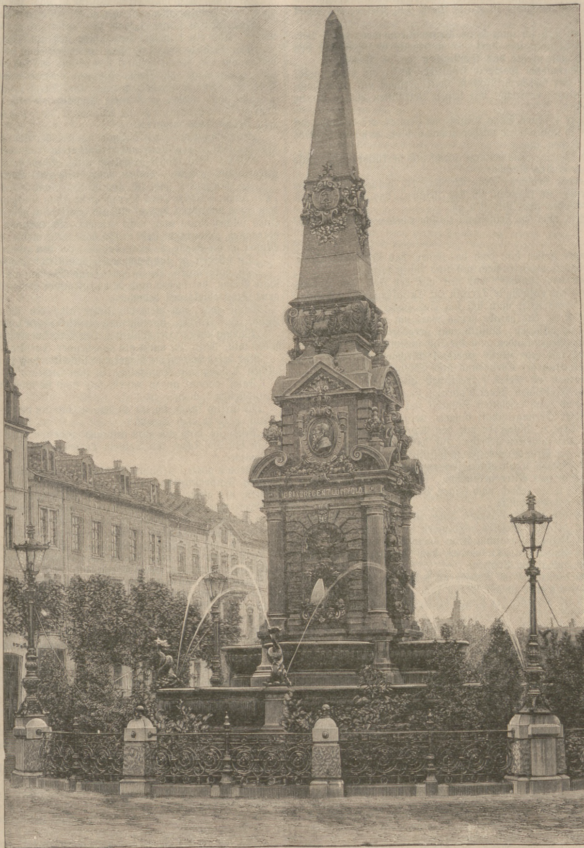
Der Luitpold-Monumentalbrunnen in Ludwigshafen. Errichtet von Architect Brunner. (Mit Text.)

Willich blickte bestürzt sein unerschrockenes Töchterchen an und