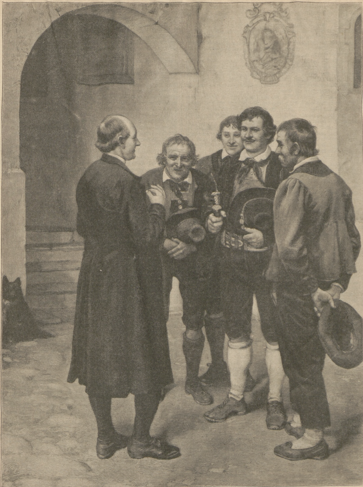
Bauern-Deputation. Nach dem Gemälde von Franz von Defregger in München. (Mit Text.)