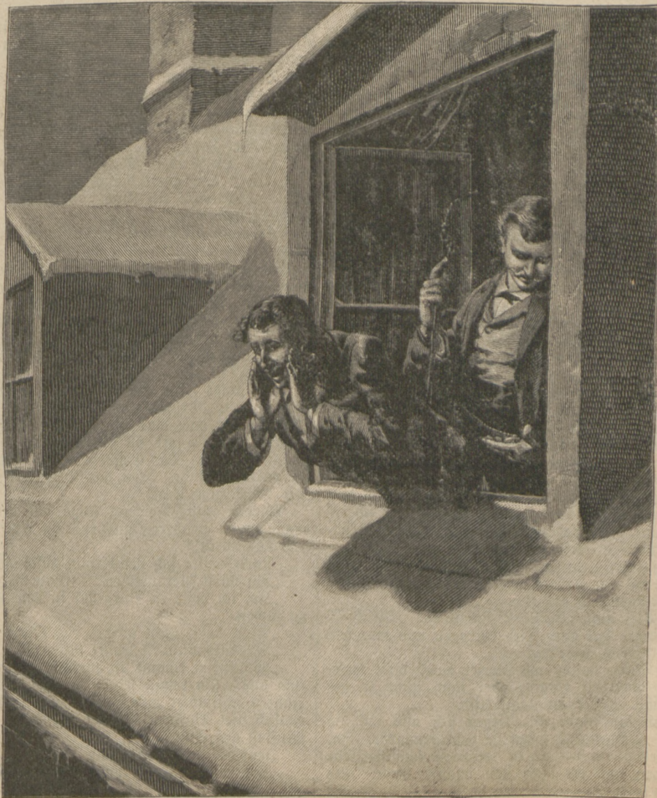
Proßt Renzjahr. Originalzeichnung von M. F. Lashar. (Mit Gedicht.)

Endlich strich er mit der Rechten über die Stirn hin und alle trüben Erinnerungen gewaltsam abschüttelnd schritt er rasch auf dem Wege, welcher sich dicht am Saume des Waldes hinzog, weiter. Jede seiner Bewegungen verriet Kraft und Festigkeit. Man konnte sein Gesicht kaum hübsch nennen, wohl gaben ihm aber die dunkeln Augen und der feingeschnittene Mund einen interessanten Ausdruck, der durch die Blässe des Gesichtes noch erhöht wurde. Wenn das Gesicht ruhig war, machte sich ein Zug der Entsagung auf ihm erkennbar, nicht jener freiwilligen, gleichsam in