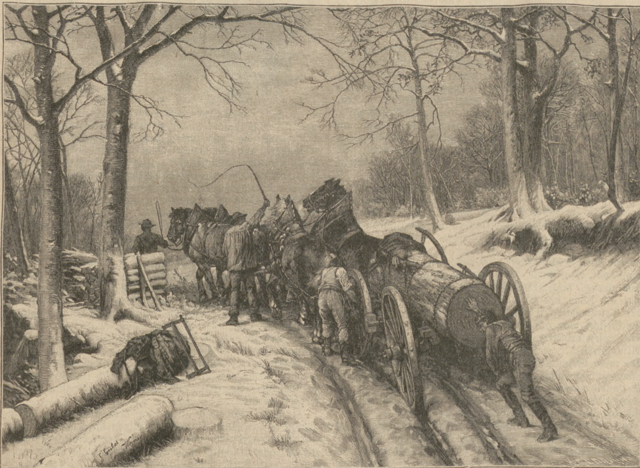
Schwieriger Transport. Nach dem Gemälde von E. Geibel. (Mit Text.)

Talent hatten zwar nur sehr wenige von ihnen, aber das scha-