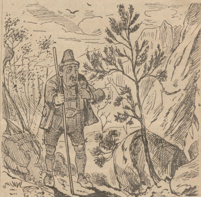
Wo ist Sahraleben mit'm Kebeckche?

Mitgetheilt aus dem Patent-, technischen und Verwerthung-Bureau Belche, Berlin S., Neue Köhlerstraße 1. (Dieses Bureau erteilt den Lesern unseres Blattes kostenlos Rath in allen Patent-, Gebrauchsmuster-, Marken- und Musterrecht Angelegenheiten.)