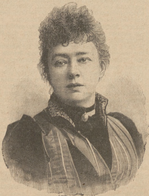
Baronin Bertha von Suttner.