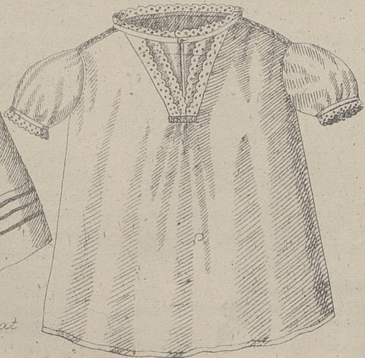
Parianczka dla dziewczynki od 1 1/2 do 3 lat