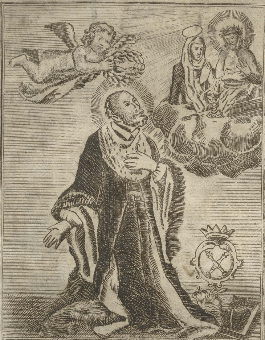
B. IOANNES CANTIUS Polonus, SS. Thicæ, in Vniuersitate Cracouiensi Doctor, et Pro- fessor, Presbyter Secularis, Miraculis Clarus.