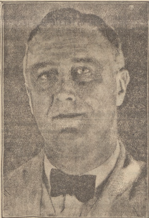
Franklin D. Roosevelt

Die Vereinigten Staaten von Nordamerika standen am Dienstag im Zeichen der Präsidentschaftswahlen. Nachdem bis in die letzten Tage hinein nach der allgemeinen Auffassung Roosevelt einen starken Vorsprung vor Hoover hatte, ist die Presse am Dienstag doch wieder unsicher geworden, nachdem beide Parteien durch den Rundfunk noch einmal an ihre Wähler appelliert hatten. Die Entscheidung für Hoover muß nach allgemeiner Ueberzeugung durch die Stimmen der Wahlmänner von New York fallen. Da zwischen New York und Kalifornien ein Zeitunterschied von drei Stunden besteht, kann der Wahlausgang bereits entschieden sein, bevor die kalifornischen Wahllokale überhaupt geschlossen worden sind.