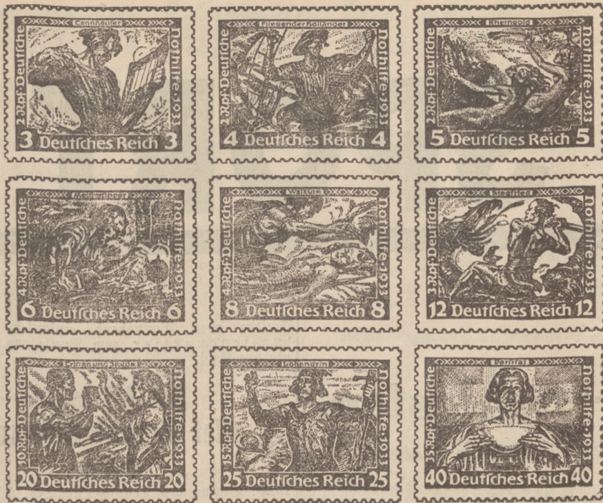
Die neuen Wohlfahrtsbriefmarken der Deutschen Reichspost

Freitag, 14 Uhr, Mincha in beiden Synagogen, 17,30 Uhr Abendgottesdienst und Predigt in beiden Synagogen; Sonnabend, 8 Uhr, Morgengottesdienst in der großen Synagoge, 7,15 Uhr in der kleinen Synagoge, 11 Uhr Predigt in beiden Synagogen, 16,15 Uhr Heiligspeisung; Sonntag, 7 Uhr, Morgengottesdienst; Montag bis Mittwoch, 6,30 Uhr, Morgengottesdienst; Sonntag bis Dienstag, 17,15 Uhr, Abendgottesdienst.