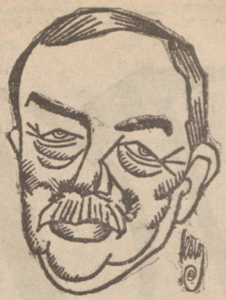
Der englische Außenminister Balfour, der zwischen Paris und Rom in Genf vermitteln soll

**) Ferner waren im Jahre 1927/28 von der öffentlichen Fürsorge in Einrichtungen der „geschlossenen Fürsorge“ vorübergehend 1 395 931 Personen untergebracht. Durch die „offene Fürsorge“ wurden in 23 085 016 Fällen Personen unterstützt.