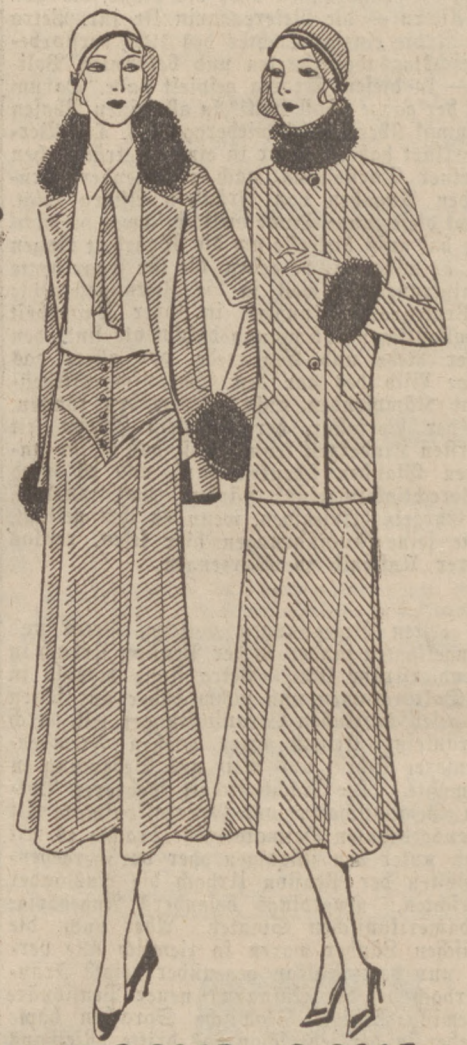
BLUSE G. 2365 G. 2365a

Nach wie vor ist das Complet das beliebteste Kleidungsstück unserer Frauen; es hat sich, bedingt durch Vielseitigkeit und Abwechslung in Form und Zusammenstellung, anscheinend einen dauernden Platz in der Mode gesichert. Man hat es an warmen Sommertagen aus zarten Stoffen, aus Georgette, Crêpe de Chine und Chiffon sowie aus leichten, porösen Wollstoffen getragen und man wird es nun für Herbst und Winter aus Samt, Tweed, Tuch, überhaupt aus all den vielen, schweren Wollstoffen arbeiten. — Auf die Zusammenstellung — Rock, Bluse und Jacke, Kleid und Jacke sowie Kleid und Mantel — kommt es hier weniger an; die Hauptsache ist, daß eine Harmonie zwischen den einzelnen zusammengehörenden Dingen besteht. Neuerdings erstreckt sich diese Harmonie auch auf den Hut, der, wenn das Complet aus Tweed oder Samt besteht, gleichfalls aus Tweed oder Samt gearbeitet sein soll. Hier sei gleich erwähnt, daß man allgemein die kleine kappenartige Hutform bevorzugt; wenigstens für das praktisch gehaltene, mehr sportliche Kostüm passen diese enganliegenden Hüthen besser als die breit ausladenden Hüthen einer schönen und harmonische Ergänzung des sehr elegant verarbeiteten Nachmittagscomplets bilden. — Die meist verbreitete Completform ist die, die aus Rock, kurzer oder langer Jacke und Bluse zusammengestellt ist. Es muß nun, damit das Completmäßige betont hervorgehoben wird, die Bluse der Bluse, wenn auch in einem helleren Ton, gut