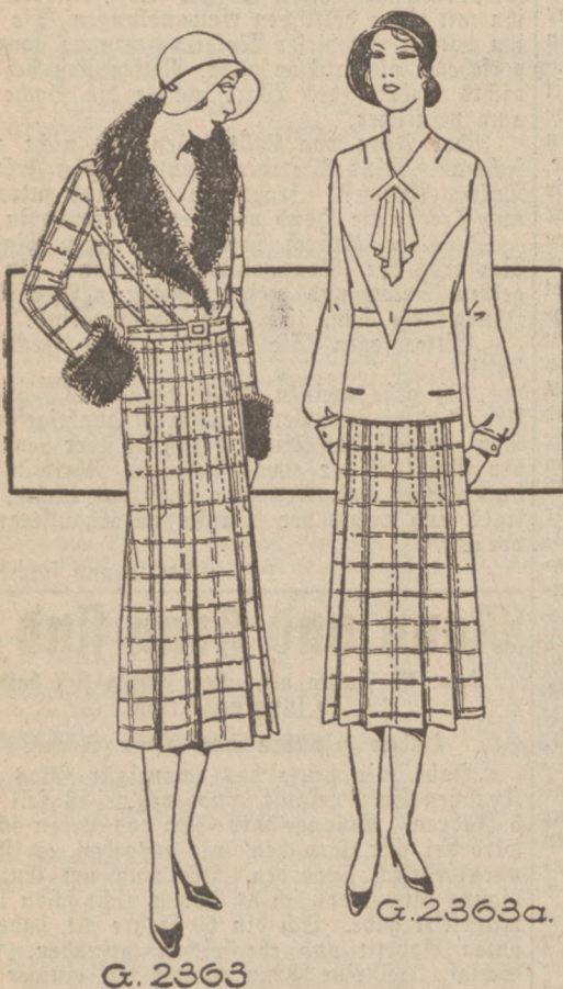
G. 2363/63a Ensemble aus bräunlichem Tweed für Mantel und Rock und rosafarbenem Crêpe de Chine für die Bluse, die vorn passentartig geteilt ist. Rock und Mantel sind mit Falten ausgestattet. Am Mantel Pelzfragen und ebensolche Armelausschlüge. Lyon-Schnitt, Größe 44 erhältlich. (Für den Mantel und den Rock: großer Schnitt, für die Bluse: kleiner Schnitt.)

Das verbreitetste Buch ist die Bibel, die in etwa 500 Millionen Exemplaren verbreitet und in 630 Sprachen und Dialekten übersezt ist.