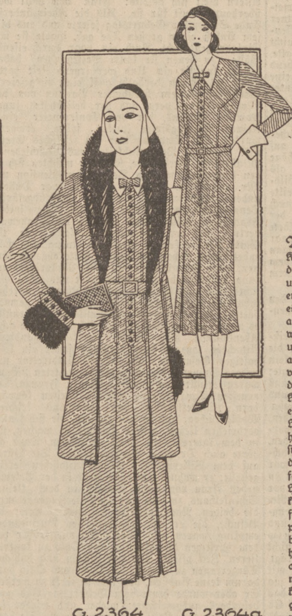
zum Wollstoff passen; bei karierten Geweben wählt man eine im Karomuster enthaltene. An einer schlichten Hemdbluse, die eventuell auch ganz Weiß gehalten sein kann, wird die Krawatte wiederholen. — Sehr beliebt ist auch das Complet, das aus einem Kleid und einer halblangen Jacke zusammengestellt ist (G. 2364/64a). Hier werden natürlich beide, Kleid und Jacke, aus einem Stoff gearbeitet, meist aus einem melierten, dunkel getönten Wollstoff. Es wirkt natürlich sehr elegant, wenn für das Kleid ein leichteres und für den Mantel (oder die Jacke) ein schwereres, in Farbe und Musterung genau harmonisierendes Material genommen wird. — Zu allen Modellen sind Lyon-Schnitte erhältlich.