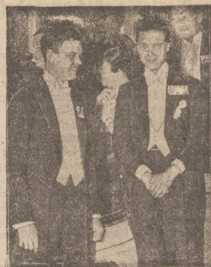
Unruhen in Südamerika

Die Reise des Prinzen von Wales nach Südamerika soll bei der nordamerikanischen Geschäftswelt eine derartige Beunruhigung hervorgerufen haben, daß man beabsichtigt, als Gegenzug den vergötterten Charles Lindbergh auf eine Luftreise nach Südamerika zu entsenden. Unser Bild zeigt von links Lindbergh und den Prinzen im eifrigen Gespräch.