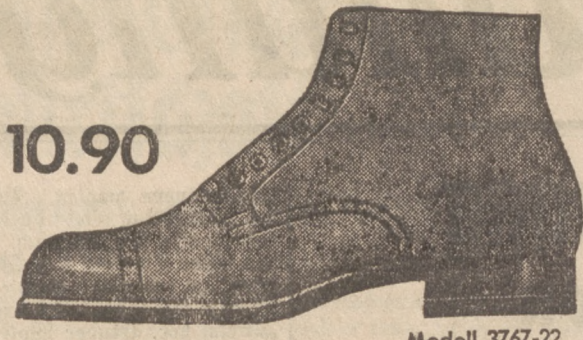
Modell 3767-22 Arbeitsstiefel aus schwarzem Box mit Kernleder-sole und doppelt genageltem Lederabsatz. Sehr preiswert.