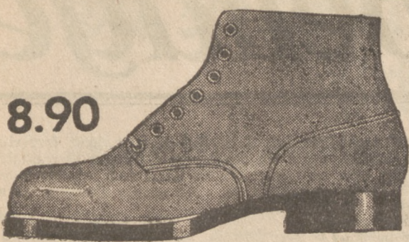
Modell 0767-00 Arbeitsstiefel aus solidem, fetthaltigen Rindleder mit fast unverwundlicher Gummisohle. Spezialschuh für alle Berufe.