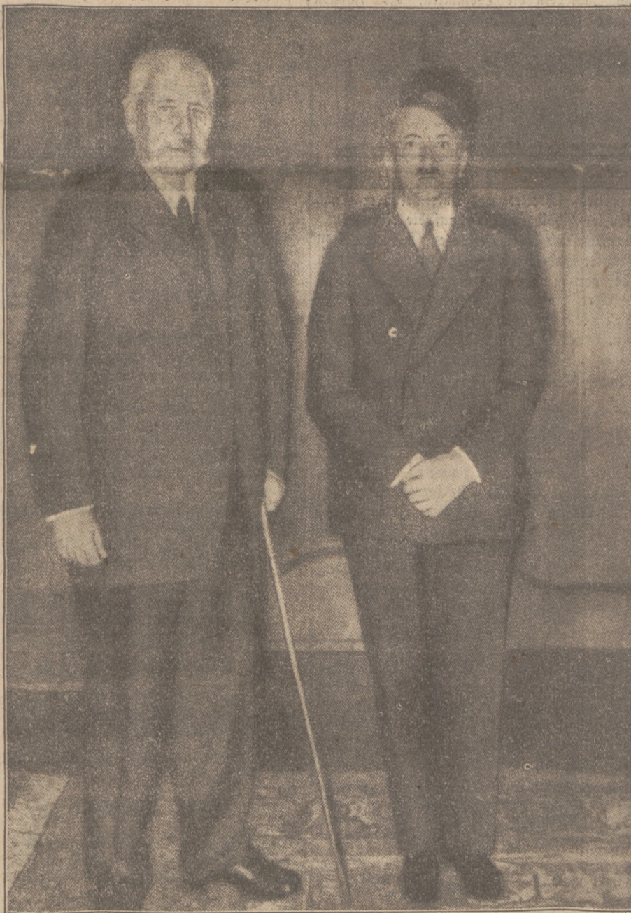
„Ich hatt' einen Kameraden. . .“

Fahnen über Fahnen. Ununterbrochen werden kostbare Kränze niedergelegt. Alle Stunden löst