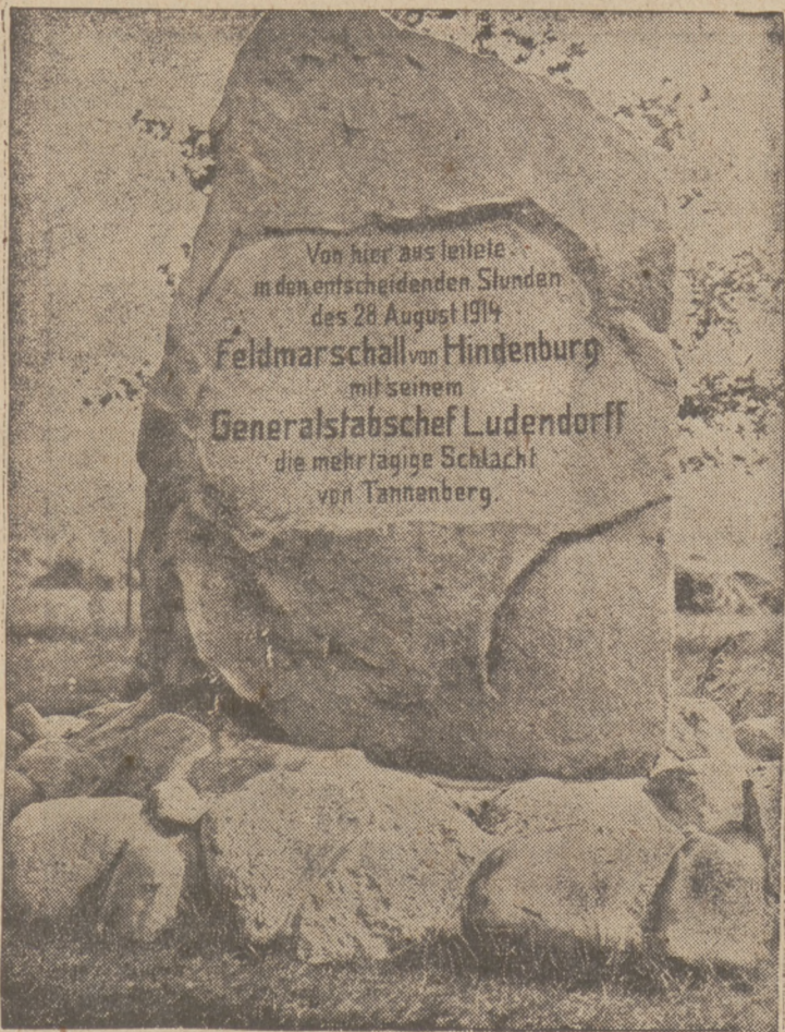
Der Denkstein auf dem Feldherrnhügel.

Paris, 7. August. Die Häufung brutaler Maßnahmen, insbesondere zahlreicher Ausweisungen gegen die früher angeworbenen polnischen Bergleute in Frankreich hat am Montag im Grubengebiet von Lens zu einem schweren Zusammenstoß geführt. 200 freitende polnische Bergleute, die ausgewiesen werden sollten, da sie angeblich vor kurzem an einem Streik als „aufrührerische Elemente“ teilgenommen hatten, verschanzten sich in einem 300 Meter tief gelegenen Stollen, nachdem sie die Licht- und Telefonanlagen durchgeschnitten hatten. Die französischen Aufseher, die sich zu widersetzen suchten, wurden von ihnen gefangen genommen. Obwohl die Bergleute keine Nahrungsmittel bei sich hatten, zogen sich die Verhandlungen bis Dienstag hin und erst Dienstagabend wieder waren die Streikenden ausgefahren.