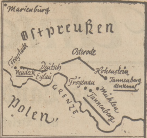
Der Weg von Hindenburg zum Tannenberg-Nationaldenkmal.

Dieser Stein bezeichnet die Stelle, an der Hindenburg am 28. August 1914 die Tannenberg-Schlacht leitete.