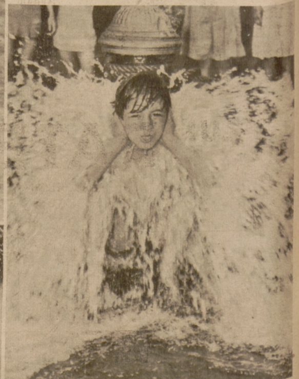
Hier „verbreitert“ der Junge den Strahl des Hydranten, und dieser spendet freigebig Erfrischung