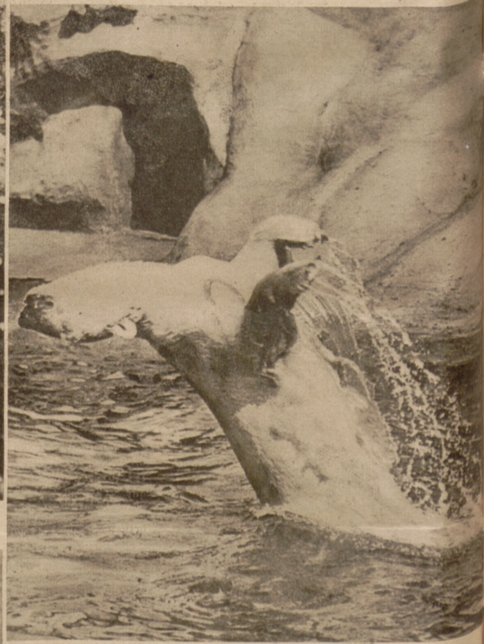
Der Eisbär wirft sich verzweifelt in das Wasser seines Beckens, das ihm bei der sommerlichen Hitze nur geringe Erfrischung bringt