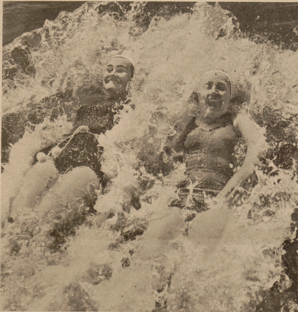
wenn zwei Nigen im kühlen Wasser pantschen