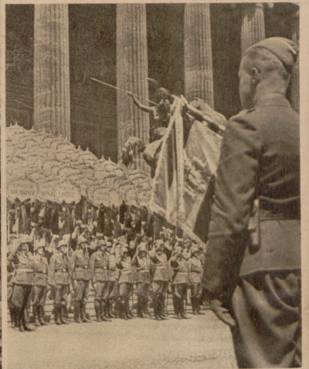
Beim Staatsakt standen Angehörige der Legion auf den Stufen des Alten Museums und trugen die Namensschilder der auf den Schlachtfeldern in Spanien gefallenen Freiwilligen Atlantic