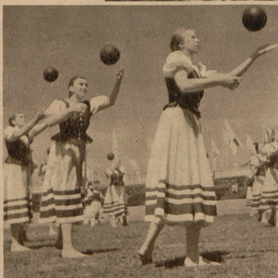
Mädels der Reichsschule des Reichtnährstandes „Burg Neuhaus“ zeigen Ballvorführungen auf dem Freigelände der Ausstellung Binder