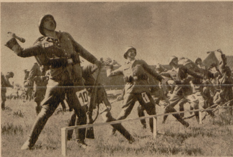
Während des Mannschaftsgepäckmarsches waren auf der Wehrkampfbahn schwierige Übungen zu erfüllen, z.B. Handgranaten-Zielwerfen, das hier von der Mannschaft der Provinz Westfalen ausgeführt wird