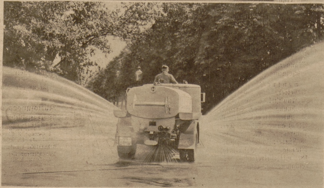
Das ist eine wohltätige „Spritze“ gegen „Affen“hitze