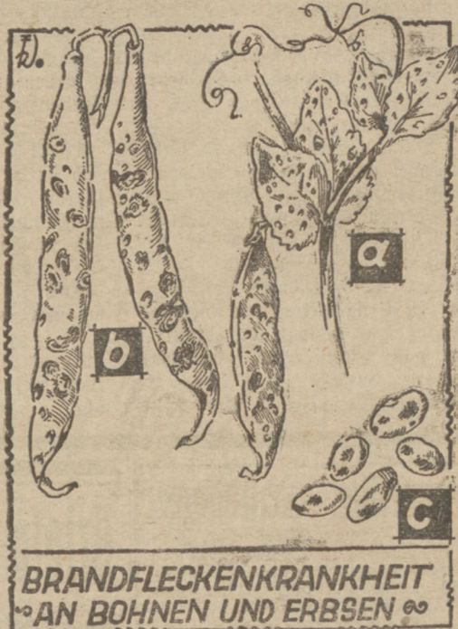
BRANDFLECKENKRANKHEIT AN BOHNEN UND ERBSEN

Blattfleckenkrankheiten an Erbsen und Bohnen. Am häufigsten tritt die durch den Pilz Ascochyta verursachte Blattfleckenkrankheit bei den Erbsen auf, weil sie hier nicht nur die Blätter, Stengel und Früchte (s. Abb. a) befällt, sondern sogar die in den Hülsen sich ausbildenden Samen ergreift und die Ernte empfindlich schmälert. Solche vom Pilz angestechten Samen, an denen man bei der Reife nur dunklere, kleine Flecke wahrnehmen kann, bilden im Frühjahr den Ausgangspunkt für die Krankheit. Während des Wachstums werden die Sporen des Pilzes besonders durch Regen leicht verbreitet. Auf den Überresten erhält sich die Ascochyta pisi am Leben und verseucht den Acker, wodurch im nächsten Jahre auch die aus gesundem Saatgut wachsenden Pflanzen befallen werden. Deshalb müssen zur Verhütung einer Ansteckung vom Boden aus die Pflanzenreste nach der Ernte sorgfältig gesammelt und verbrannt oder tief untergegraben werden. Beizversuche befriedigen nicht voll, wenn die Beizung auch den Befall verringert. Mehr