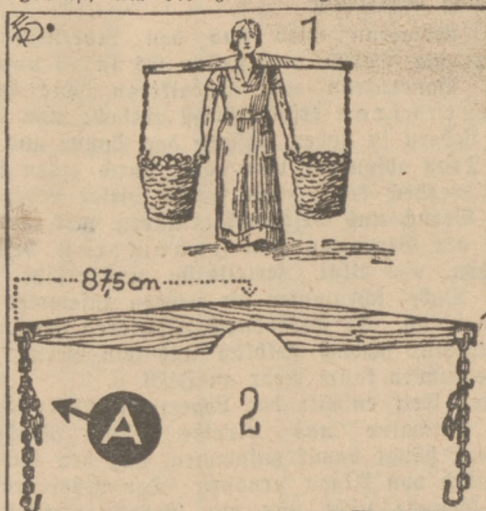
Nach Angaben des Verfassers gezeichnet von Rasper (W).

Um hier eine Abhilfe zu schaffen, habe ich mir eine neue Wassertrage (Abbildung 1) anfertigen lassen, die nur etwas länger ist, als die zum Tragen von Wassereimern