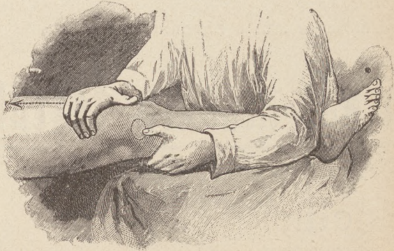
Massage. Reiben und Streichen bei Kniegelenkentzündung. Nach Dr. Reibmayr.

logie, Physik und Chemie, die Lehre vom Stoffwechsel, der Säuglingsernährung, die Lehre von den Krankheitsursachen, namentlich den Ursachen der ansteckenden Krankheiten und daran anschließend die neuen Bestrebungen der Therapie, die Schutzimpfungen und die