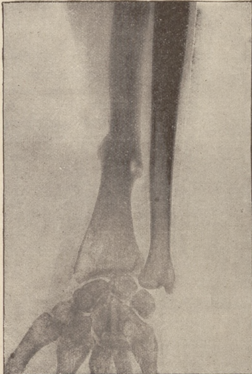
Röntgenstrahlen. Geheilter Unterarmbruch (Bruch der Speiche).

Wie sehr Bock's Buch vom gesunden und kranken Menschen den Anforderungen entspricht, die man an