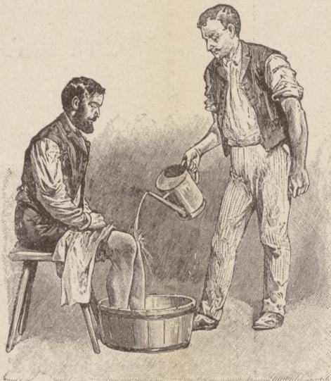
Wasserbehandlung. Kniegüß. Nach Kneipp.

Ungearbeitet und auf den gegenwärtigen Stand der Wissenschaft gebracht wurden namentlich die vorbereitenden Abschnitte aus dem Gebiete der Anthro-