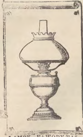
LAMPY FAWORYTA Z PROMIENIEM KULISTYM