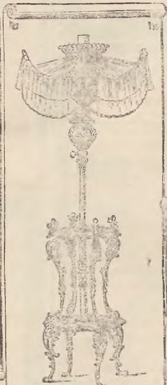
LAMPY STOLIKOWE Z ZASZONĄ KORONKOWĄ,