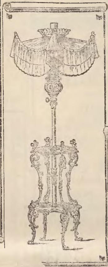
LAMPY STOLIKOWE Z ZASZONĄ KORONKOWĄ,