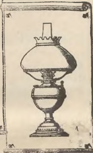
LAMPY „FAWORYTA“ Z PROMIENIEM KULISTYM