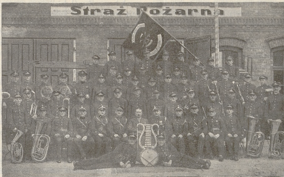
Ochotnicza Straż Pożarna w Rybniku.

Pierwszy Statut pod nazwą: „Statut des freiwilligen Feuerlösch- und Rettungs-Vereines zu Rybnik“ został wydany dnia 25 lipca 1875 r. Poprawiony i zatwierdzony przez Policję „Statut“ z dnia 20 kwietnia 1884 r. określa na owe czasy bardzo dokładnie cele i zadania związku, który działa na terenie miasta Rybnik włącznie Kolonji Brzeziny, Wawok i Paruszowice.