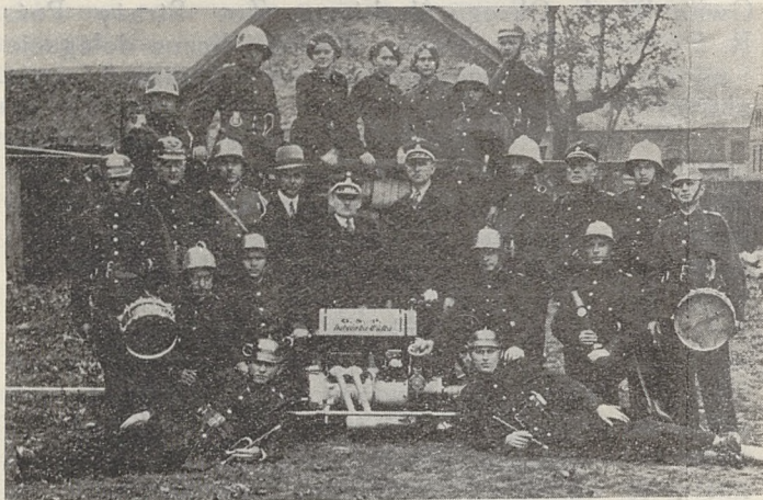
Ochotnicza Straż Pożarna w Dąbrówce Wielkiej w dniu obchodu św. Floriana