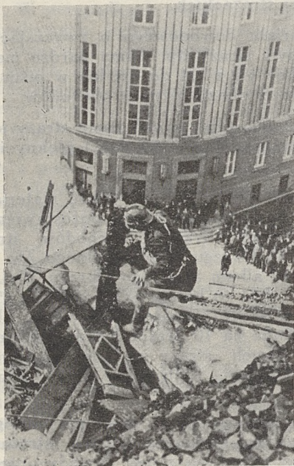
Fragment z pożaru Ubezpieczalni Społ. w Bielsku

W nocy z dnia 25 na 26 kwietnia br. o godz. 23 min. 30 zaalarmowano Ochotniczą Straż Pożarną w Bielsku do pożaru, który wybuchł w gmachu Ubezpieczalni Społecznej w Bielsku. Pożar powstał z niewiadomych przyczyn na strychu i prawdopodobnie został zauważony z opóźnieniem, bo kiedy straż po zaalarmowaniu przybyła natychmiast z pomocą, zastała już cały strych, konstrukcję dachową i pomieszczenia, znajdujące się pod strychem, w ogniu. Szybkemu rozwojowi pożaru sprzyjały drewniane przepierzenia, oddzielające poszczególne pomieszczenia, i w tych warunkach miejscowa straż pożarna zmuszona była wezwać pomocy sąsiedniej straży pożarnej z Białej.