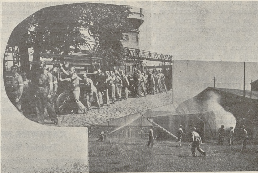
Ćwiczenia bojowe kursu dla kandydatów na szefów służby ppożarowej w opl. dla zakładów przemysłowych