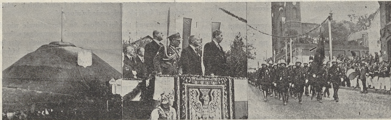
Fragment uroczystości poświęcenia Kopca Wyzwolenia w Piekarach Śl. Na lewo: Kopiec po poświęceniu; w środku: P. Wicepremier Kwiatkowski i P. Wojewoda Grażyński, na trybunie podczas defilady. Na prawo: defilada Oddziałów strażackich

W dniu 20 VI br. do Piekar Śląskich zaczęły przybywać niezliczone ilości zszeregowanych orga-