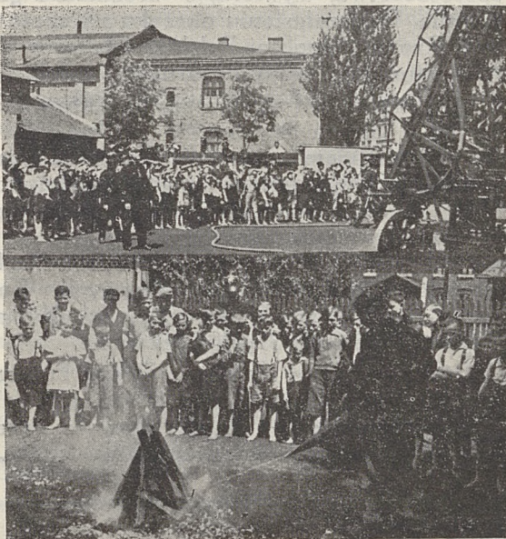
Fragment pokazów strażackich dla młodzieży szkolnej i nauka obchodzenia się z gaśnicami. Zdjęcie z terenu Straży Pożarnej w Welnowcu

W dniu 20 czerwca w obecności Władz Rządowych, Samorządowych, Wojskowych i Społecz-