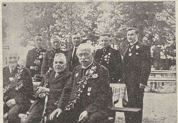
Weterani, założyciele OSP. w Halembie w otoczeniu członków Zarządu Oddziału Powiatowego w Katowicach

Koncert w ogrodzie p. Noconia, w czasie którego złożyły się różne niespodzianki, a później zabawy, zakończyły tę piękną i rzadką uroczystość.