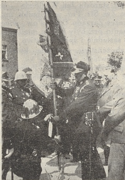
Fragment uroczystości poświęcenia sztandaru OSP. kopalni Rymer

Stwierdzić należy, że tamtejsza placówka strażacka, dzięki dużej aktywności jej członków i poparciu władz gminnych, jak i społeczeństwa, wykazuje znaczne postępy w swoim rozwoju, za co składamy wymienionym tą drogą podziękowanie i życzymy pomysłnych owoców w drugim 25-leciu.