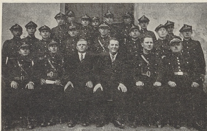
Ochotnicza Straż pożarna w Jedłowniku po egzaminach I stopnia w dniu 1 VI br.