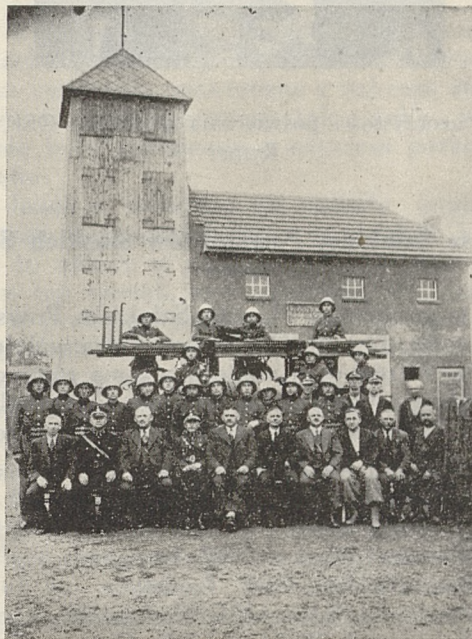
Nowo wybudowana strażnica Ochotniczej Straży Pożarnej w Chwałowicach, poświęcona w dniu 13 VI br.

W godzinach popołudniowych odbyły się zawody rejonowe przy licznych udział miejscowego społeczeństwa, wieczorem zaś zabawa.