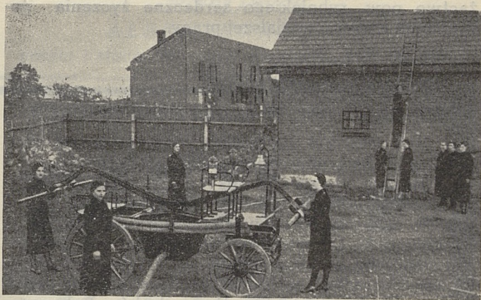
Członkinie w Wesołej przy ćwiczeniach ze sprzętem pożarniczym

Ze wszystkim obecnym tam czas miło i wesoło przeszedł, tego już nie trzeba opisywać, a tylko podziękować inicjatorom wieczornicy za jej urządzenie.