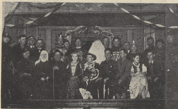
Zdjęcie członków O. S. P. w Piasecznej-Strzybnicy z odbytego przedstawienia pt. „Biała Pani z Swierklańca”

Dnia 8 maja br. Związek Straży Pożarnych RP. oddział katowicki-miejski dorocznym zwyczajem czcił dzień swojego Patrona. W rannych godzinach przemaszerowały wszystkie oddziały Powiatowej