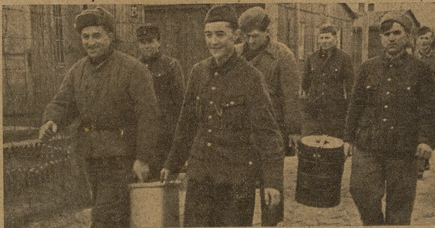
Дежурные по комнатам идут за обедом