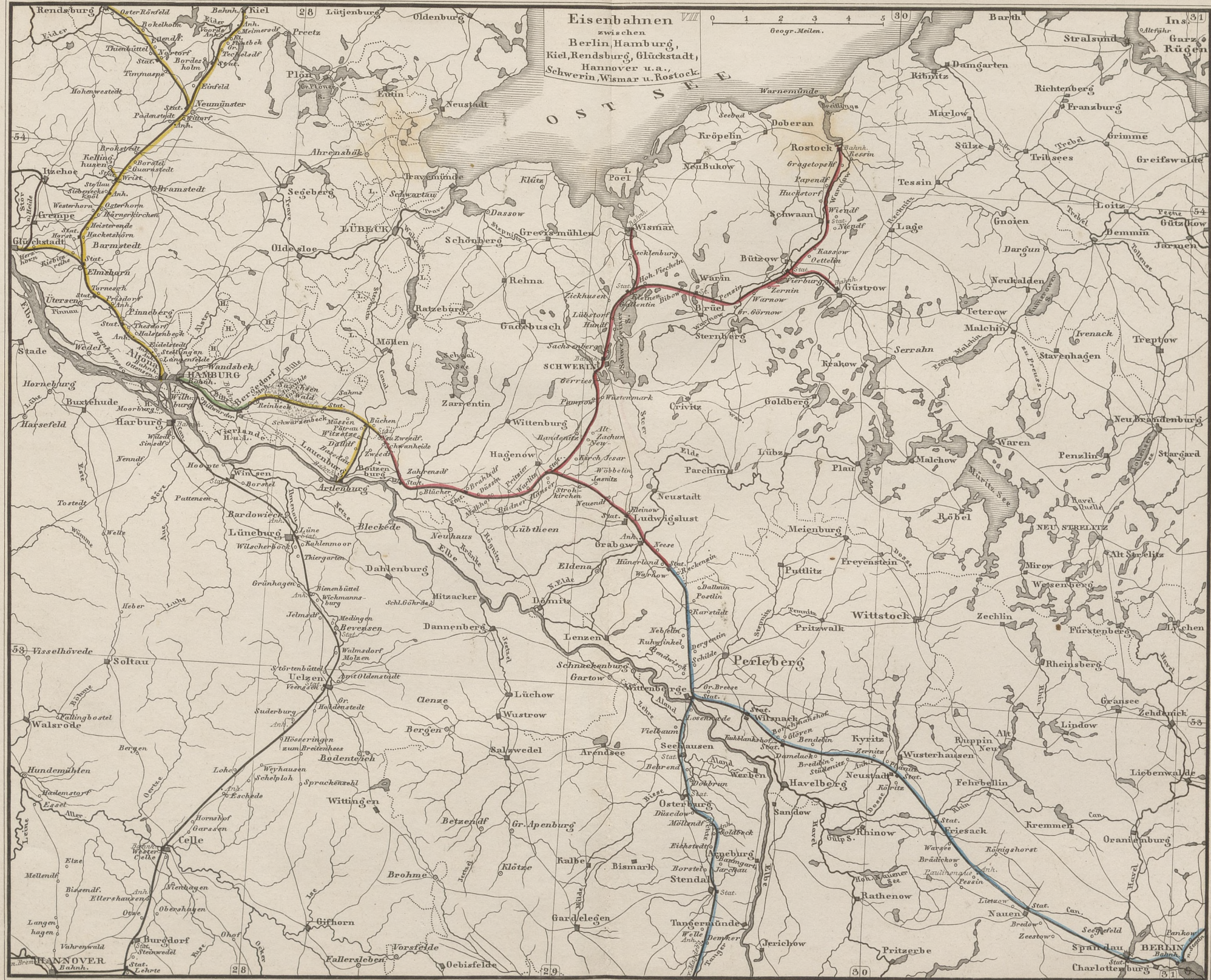
Eisenbahnen in: Preussen —; Hannover —; Holstein u. Lauenburg —; Mecklenburg —; Hamburg —.