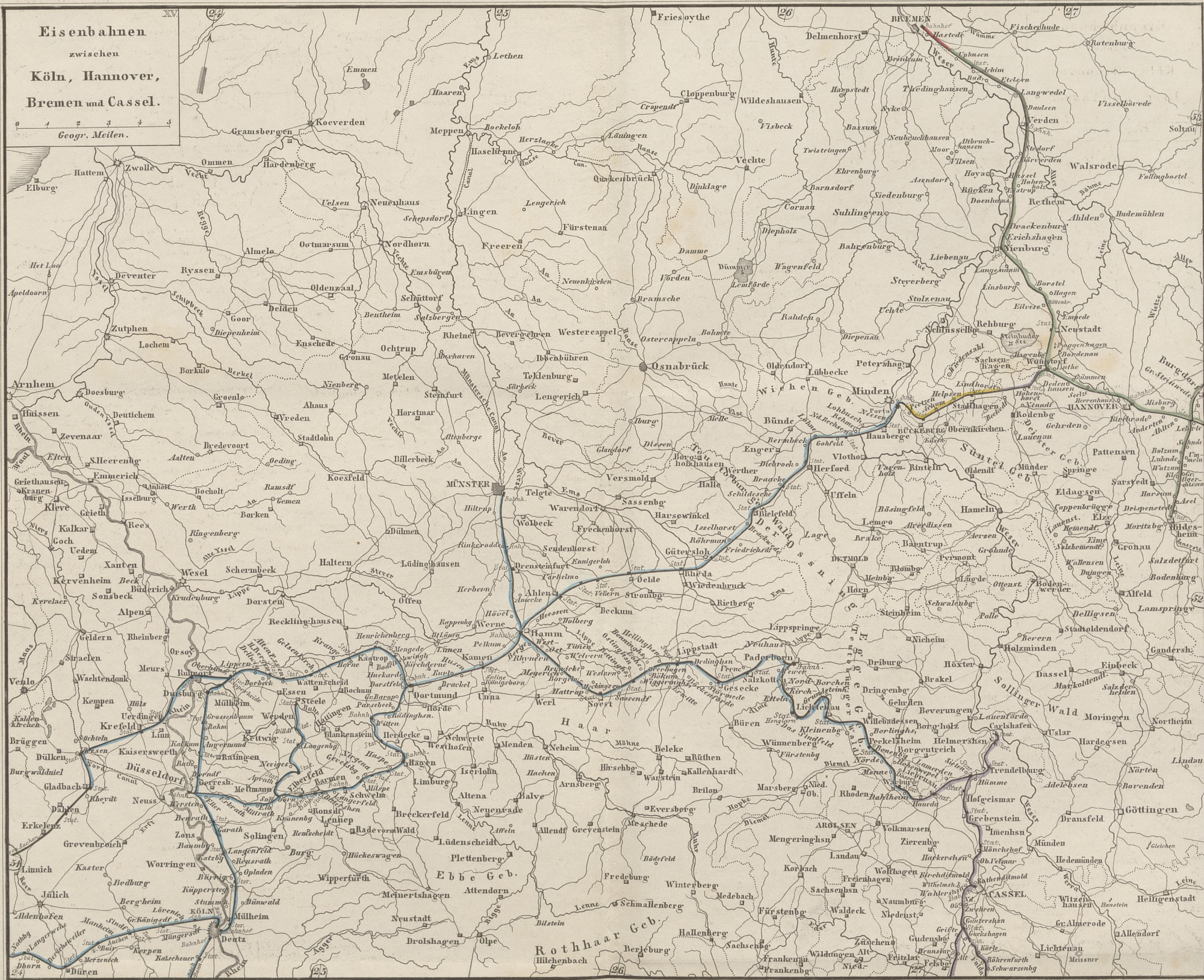
Eisenbahnen in: Preussen —, Hannover —, Kur-Hessen —, Schaumburg-Lippe —, Bremen —.