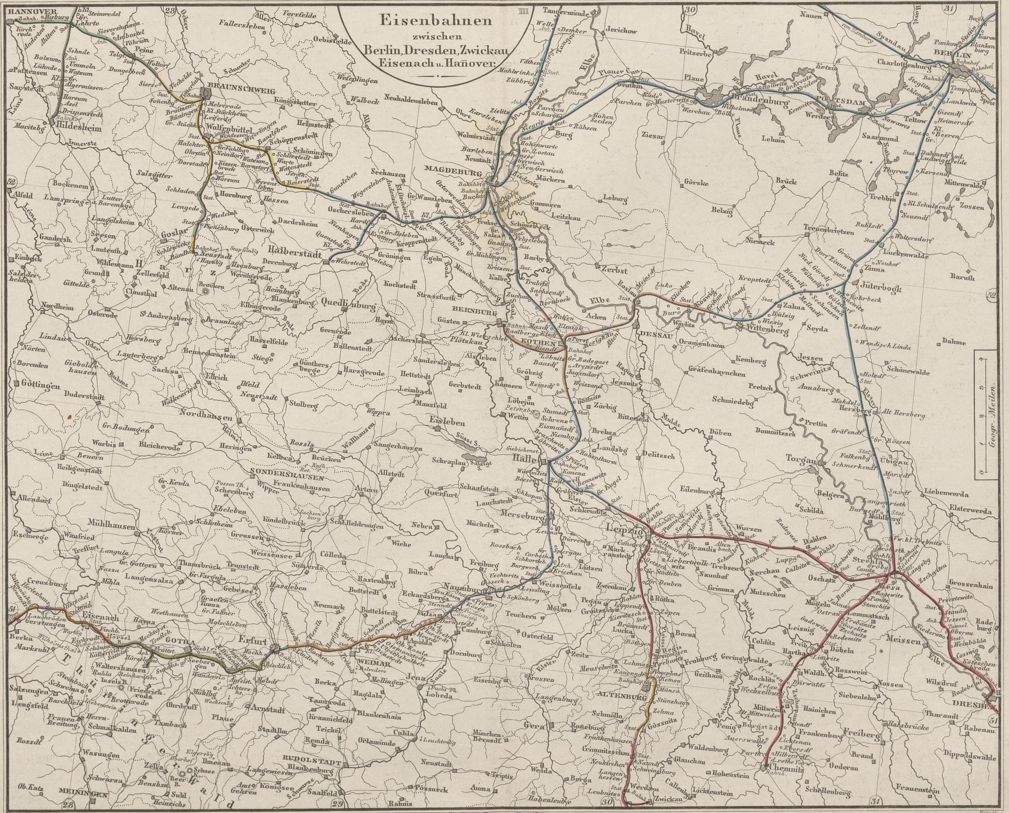
Die E.-B.-Linien sind nach den Staaten, welche sie durchziehen, colorirt: — Prussen. — Sachsen. — Hannover. — Braunschweig. — S. Weimar-Eisenach. — S. Gotha. — Altenburg. — Chur-Hessen. Gotha: Justus Perthes.