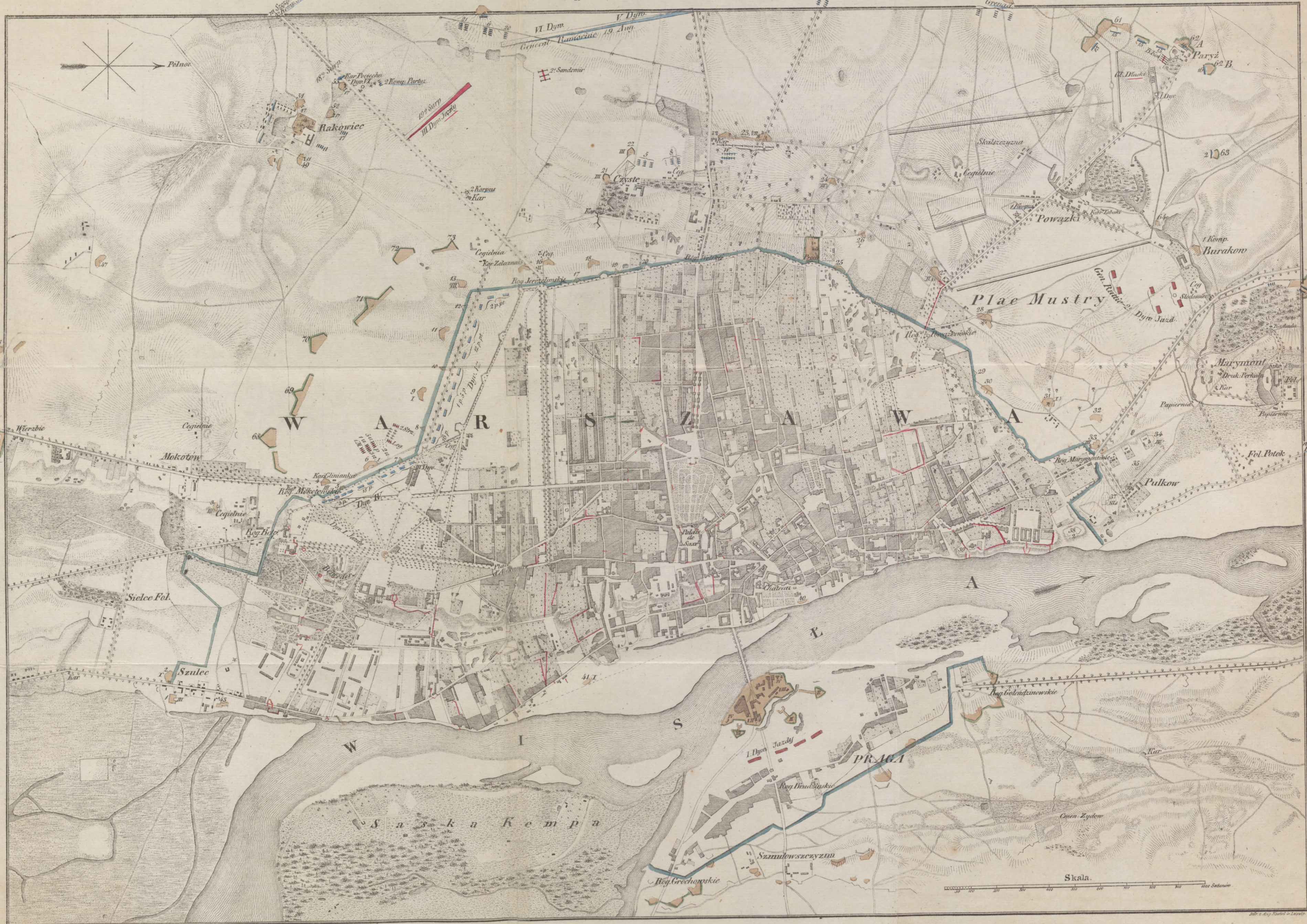
La ville, les fortifications, les barricades de Varsovie et les troupes Polonaises le 19. Aout 1831.

■ Cavallerie. ■ Infanterie. Les numeros Romains à côté des fortifications indiquent le nombre des pièces d'Artillerie, qui s'y trouvent, et ceux près des troupes les numeros des regiments. Jazdy, c'est à dire: Cavallerie. ppt (puchoty) = Infanterie. u. = Ulans. Strz. = Chasseurs. M. = Maszars. Dym. = Division. Ceg. = Cegielnie = briquerie. Kar. = cabaret. W. = General Wengierski. — Note: A l'exception des Divisions V et VI d'Infanterie et des Divisions II et III de Cavallerie, parties dans la nuit du 20. Aout avec les Gen. Ramorino et Lubinski, les troupes ont tenues les mêmes positions le 1. jour d'assaut. Seulement la 2. Brigade de la III. Div. d'Inf., placée ici à la barrière de Moskotoy, a rejoint l'autre à Czyste.