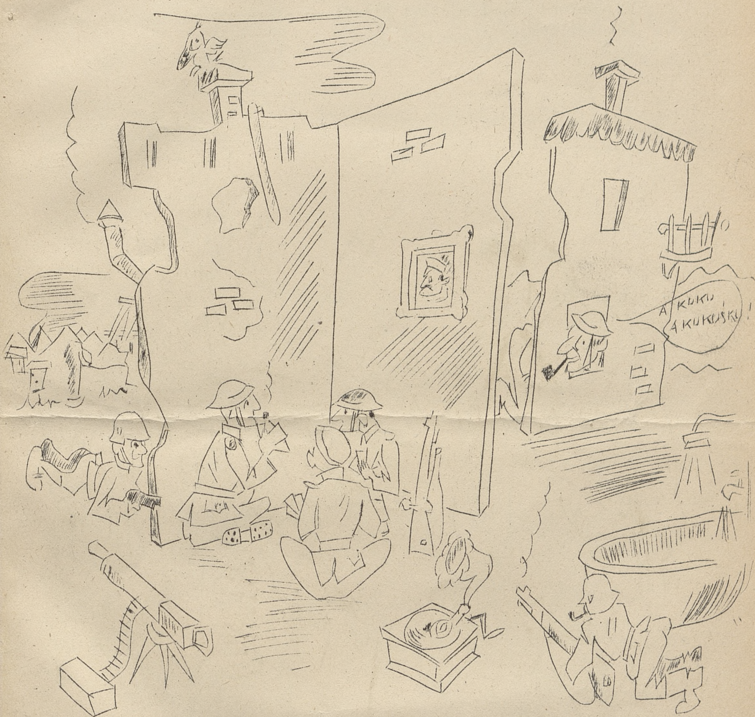
Sytuacja w Cassino...