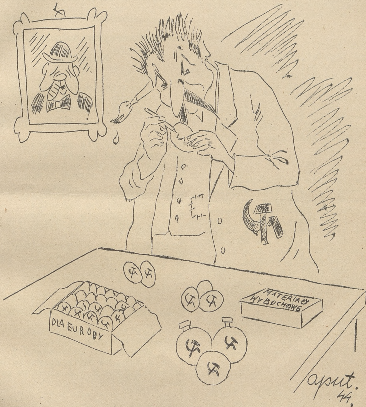
"Świąteczne pisanki" Stalina...