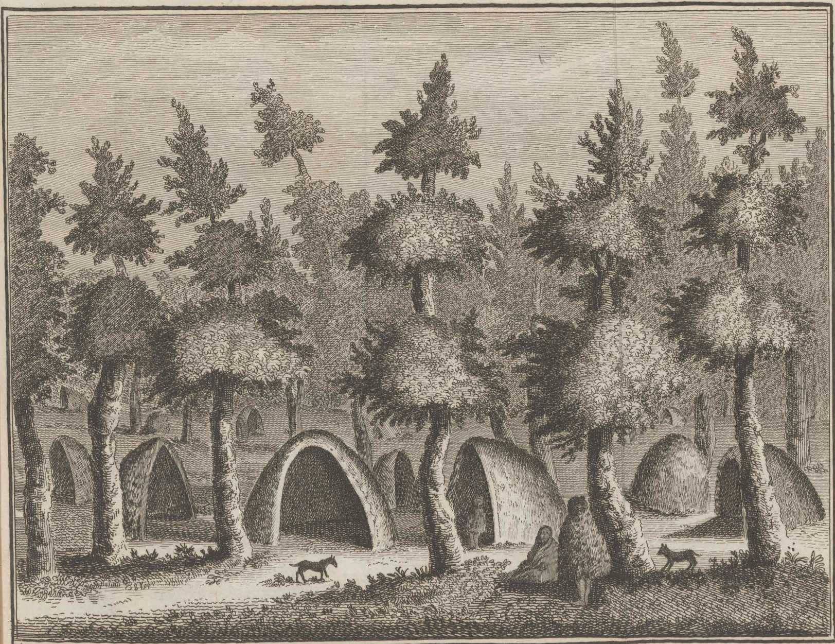
Vue d'un Village près de la Baie de bon Succes, dans l'isle de la terre de feu D.