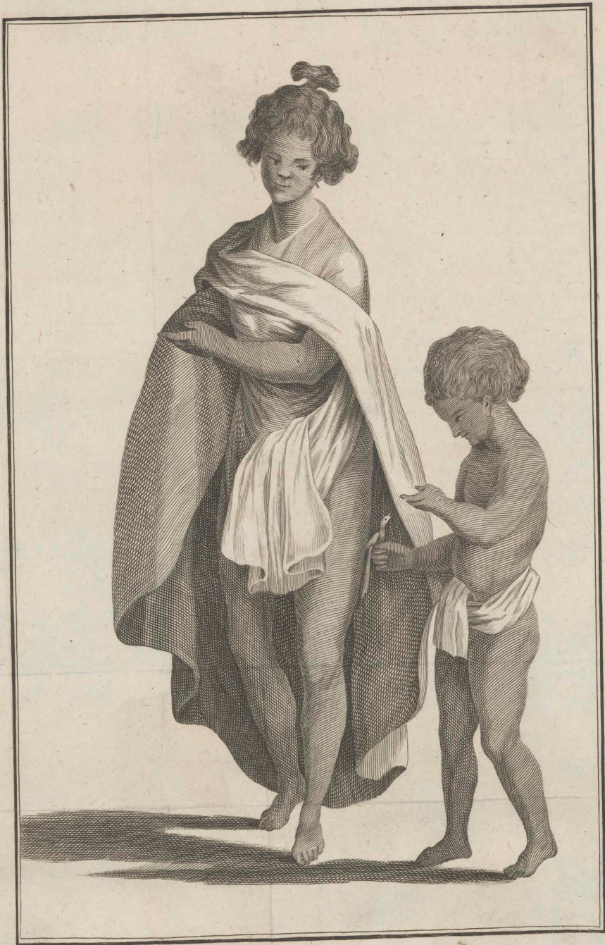
Une Femme et un Enfant de l'isle de Cati;