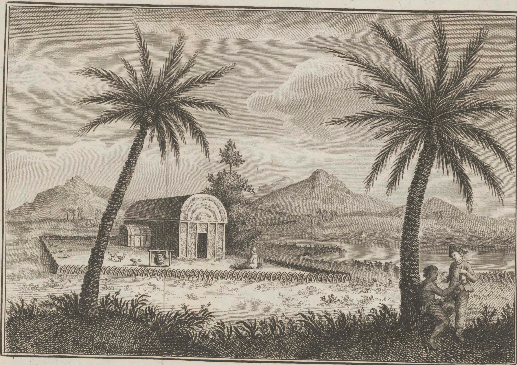
Maison et plantation d'un Chef de l'isle de Caïti