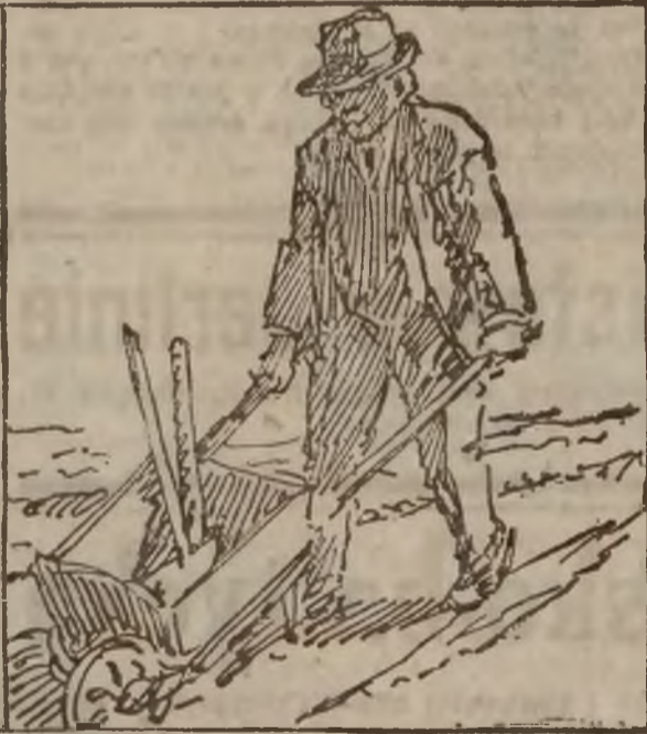
(Ubranie wewnątrz numeru na str. 7).

nina. Dziennik ów zaznacza, że Lenin jest tylko przemęczony.