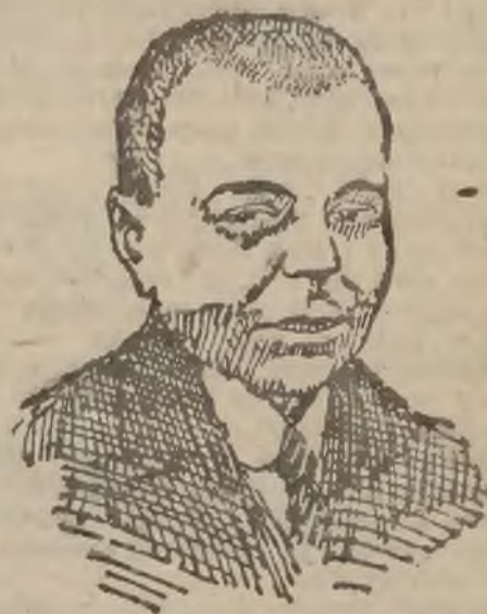
KOMUNISTA BELA KUHN.

(d) „Baseter Nachrichten” donoszą, że Krwawy dyktator bolszewicki na Węgrzech, Bela Kuhn, przebywający obecnie w Moskwie, od dłuższego czasu cierpi na rozstrój nerwowy, który przeszedł w stan przedśmiertny.