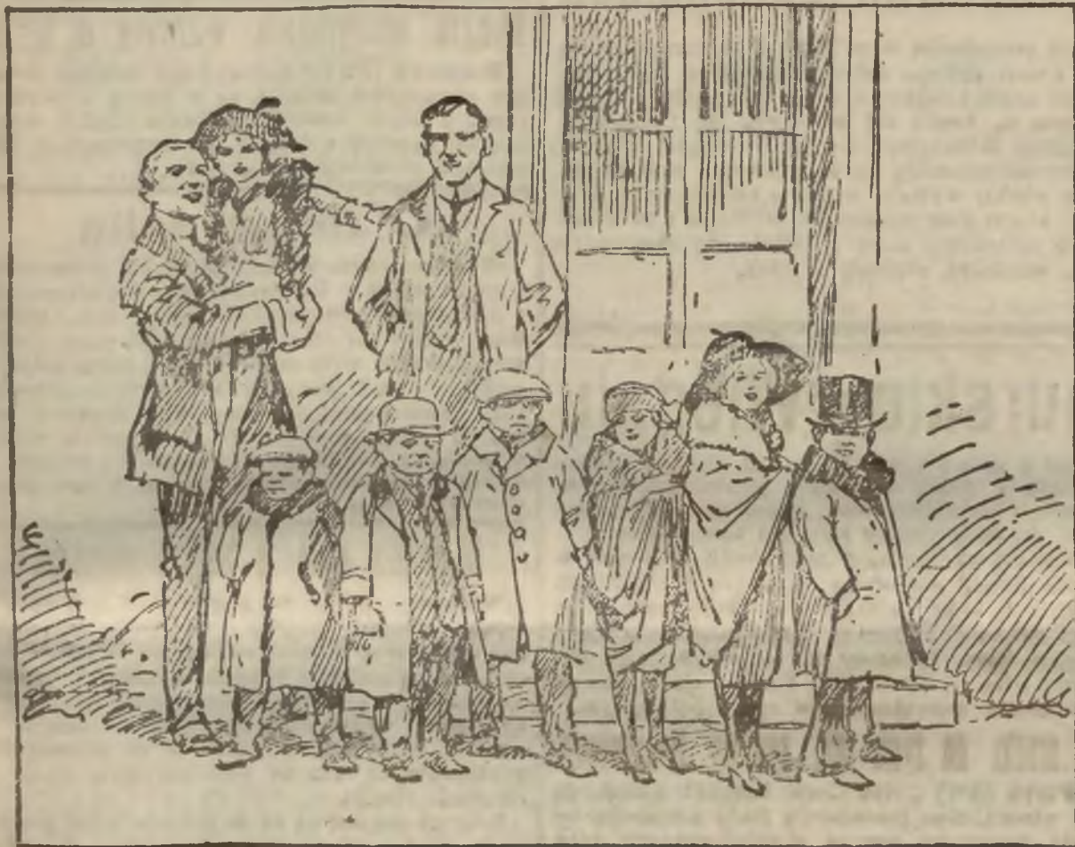
(Ubiastnienie wewnątrz numeru na str. 10).