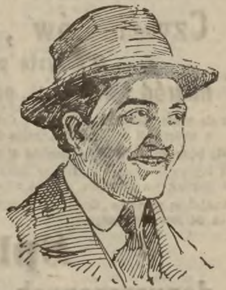
SZACH AHMED KADJAR.

(d)Szach perski Ahmed Kadjar, który niedawno temu objął rządy w Persyi, obecnie wybrał się z wizytą do Europy. Najpierw przez Niceę udał się do Paryża, gdzie był owacyjnie witany. Stamtąd wybrał się do Madrytu, skąd znowu pojedzie do Londynu, aby złożyć wizytę królowi angielskiemu.