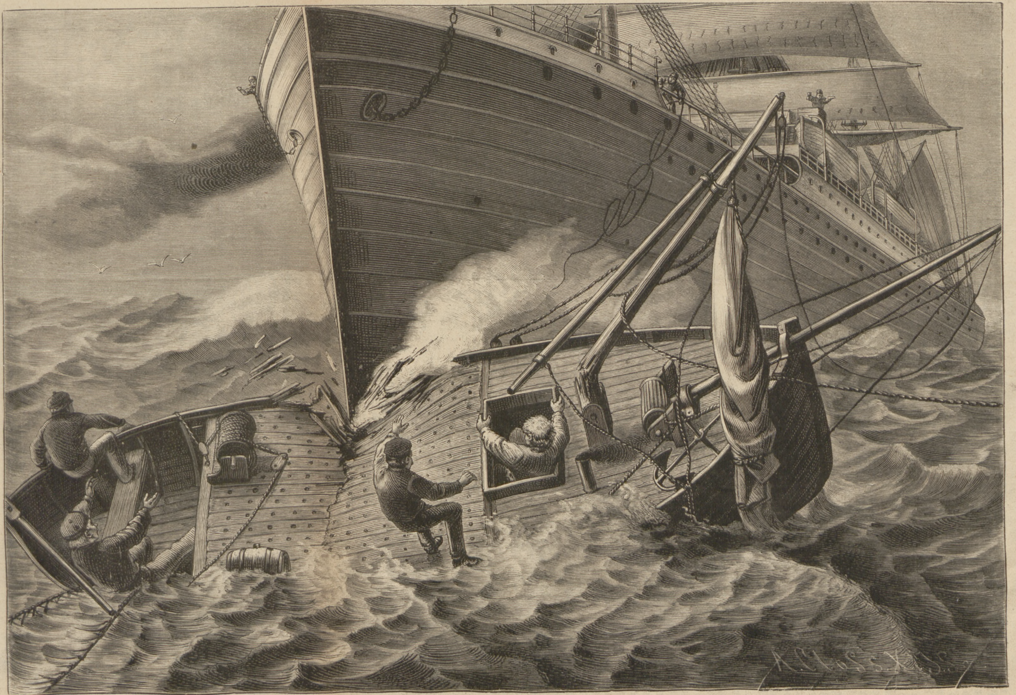
Fischkutter von einem Oceandampfer übersegelt. (S. 124)