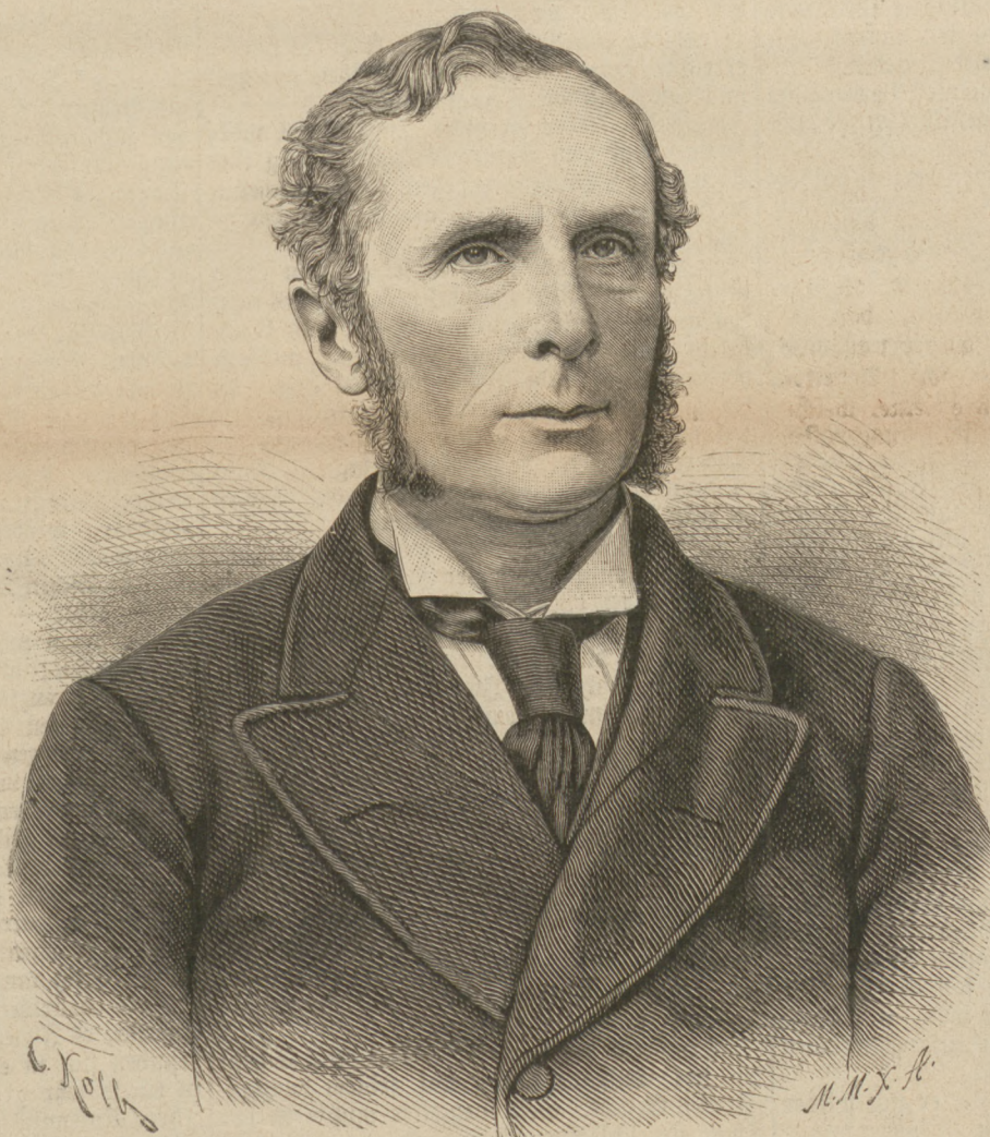
Dr. Morrell Mackenzie. (S. 124)