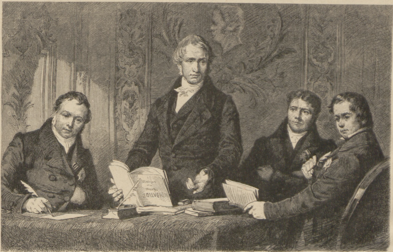
Die Begründer des Zollvereins. (S. 331)

Zunächst forberte sie Niedberg auf, das Haus ihrer Eltern aufzusuchen, sich dort vor-