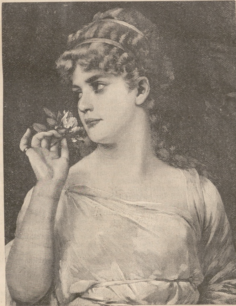
In der Rosenzeit. Nach einem Gemälde von N. Sichel. (S. 211)

„Warten nur nach dem nächtlichen Vorfall, von dem ich vorhin gehört, nicht vorgezogen hat, das Weite zu suchen!“ meinte der Polizist. „Er ist bewandert genug im