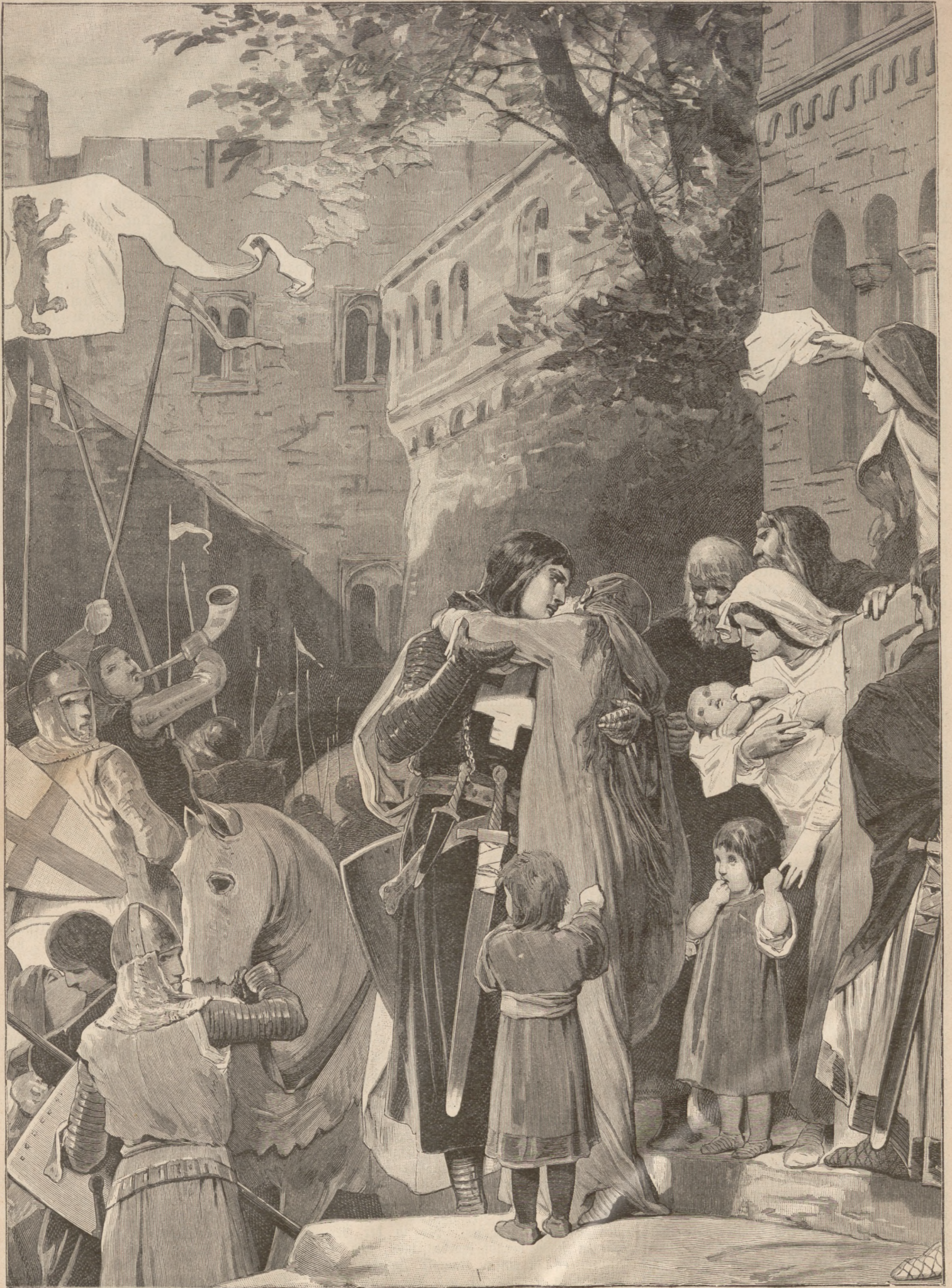
Abchied Elisabeth's von Thüringen von ihrem Gemahl bei dessen Ausbruch zum Kreuzzuge. Originalzeichnung von A. Zick. (S. 211)