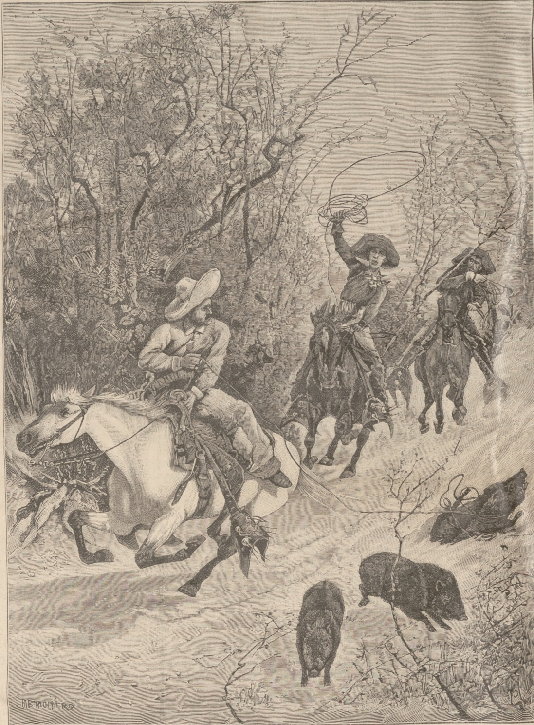
Jagd auf Bismarschweine. (S. 211)

Der alte österreichische Adel hat noch seine bestimmten mittelalterlichen Grundzüge, von denen er so leicht nicht läßt. Es kam zum