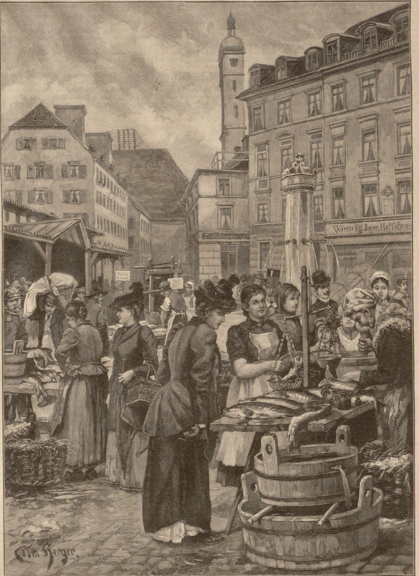
Der Fischmarkt in München. (S. 67)