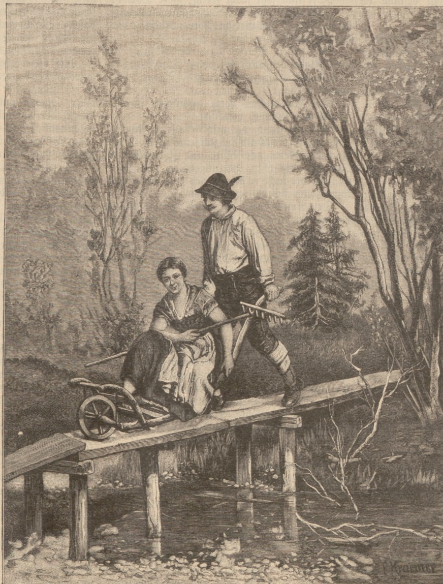
Extrapost. Nach einem Gemälde von P. Kraemer. (S. 67)