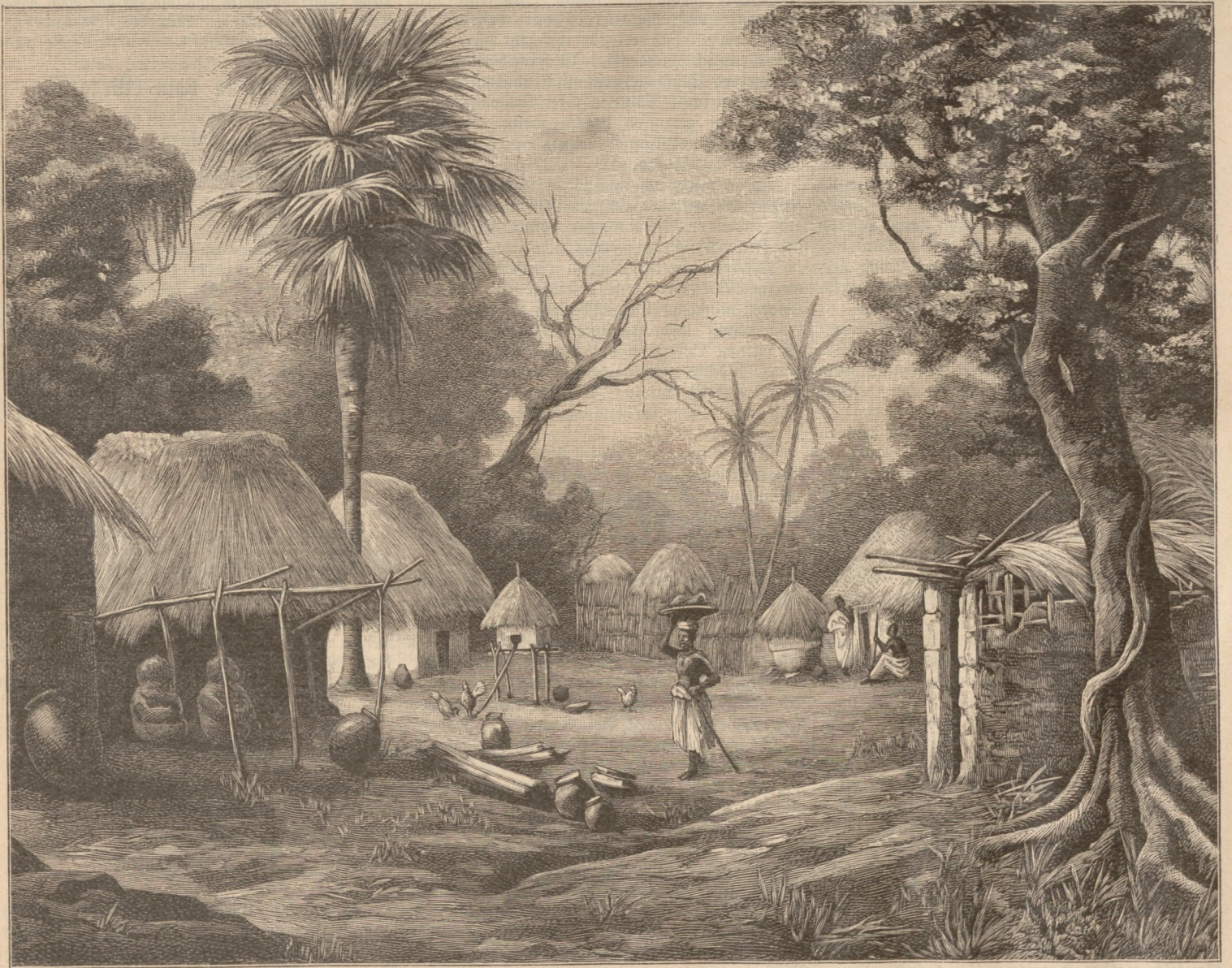
Strasse in Volu (Westafrika). (S. 67)

"Nun, dann werden Sie bald auf einen großen Grabhügel stoßen, auf dem ein altes,