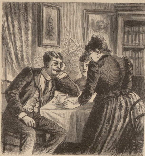
Das liebste Buch.

Tante (reich): Höre, Arthur, Du siehst so mißgestimmt aus — willst Du vielleicht etwas Beruhigung haben und von mir ein interessantes Buch geliehen erhalten? Welches wäre Dir denn z. B. am angenehmsten?